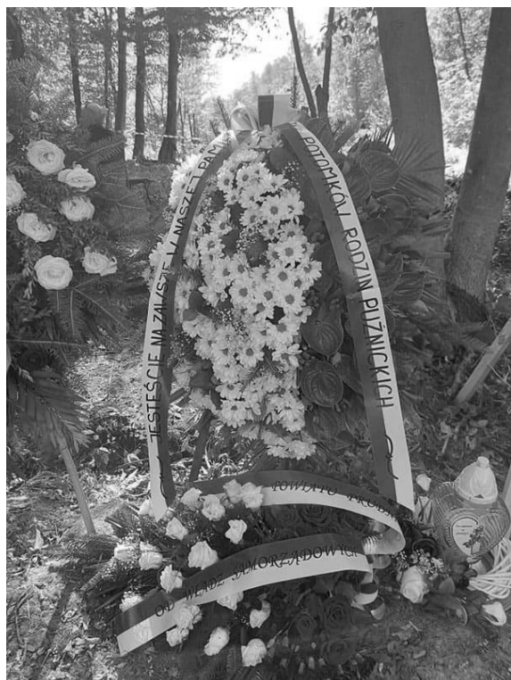
Pogrzeb ofiar w Puźnikach

społecznej przekazywane są również do kancelarii prezydenta, bo polski rząd je bagatelizuje, wyznaczając priorytet dla interesów Kijowa.