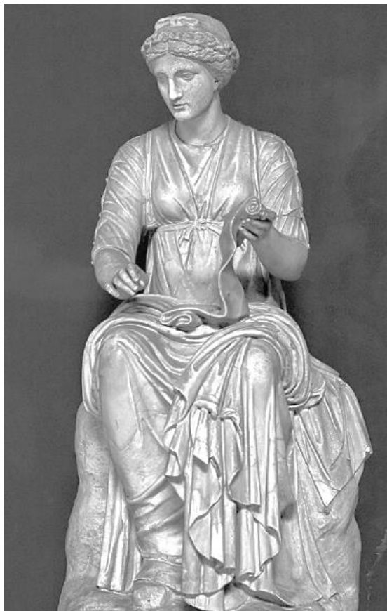
Clio, marmurowa kopia rzymska z II w. p. n. Ch. Muzeum Pio Clementino (Watykańskie)

imperatyw każdego świadomego uczestnika życia społecznego, a jednocześnie nakaz dziejowy, aby utrwałać pamięć o czasie przeszłym, pielęgnować ją i kultywować (nie tworząc kultu!), przekazywać naszym następcom, co jest powinnością wobec kolejnych pokoleń.