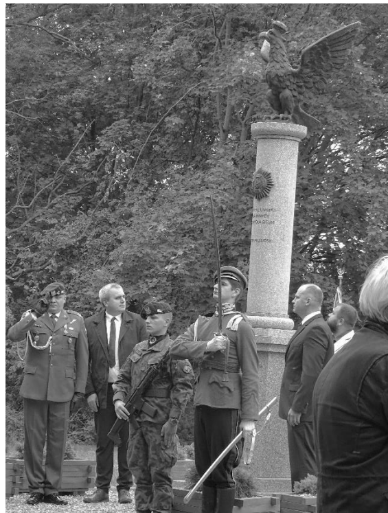
Ceremonia odsłonięcia pomnika