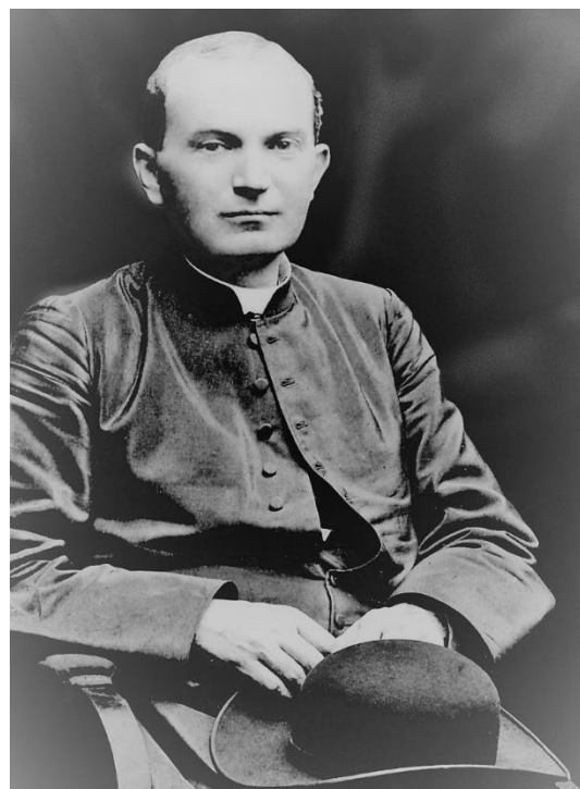
Bł. ks. Ignacy Kłopotowski

Wyzwanie nowej ewangelizacji pojawiło się w obliczu postępującej dechrystianizacji kultury Zachodu, a także bardzo długiej i nieprzebiegającej w formach ateizacji mieszkańców byłego bloku sowieckiego. Jest odnowioną świadomością potrzeby pilnego odrodzenia chrześcijaństwa, z nową pomysłowością i zaangażowaniem chrześcijan, z zastosowaniem nowych metod i środków wyrazu oraz z położeniem nacisku na te treści „dobrej nowiny”, których wymagają aktualne problemy ludzkie i współczesna kultura.