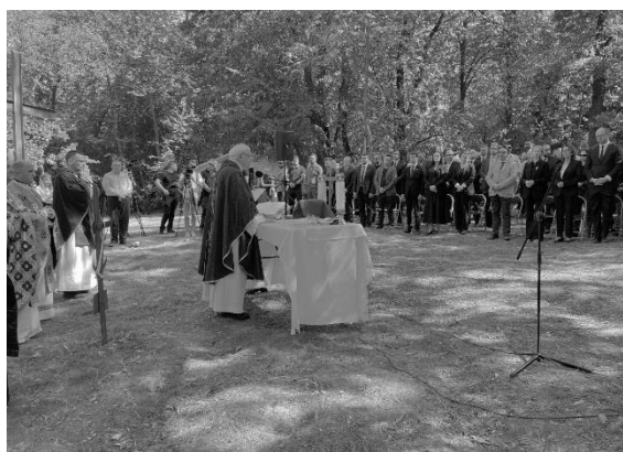
Msza Święta w Puźnikach

ków tamtej zbrodni, niezwykle sugestywne, oddające tragizm ówczesnych wydarzeń. Napisałiśmy, że podczas uroczystości Marcin Przydacz, szef Biura Polityki Międzynarodowej Kancelarii Prezydenta, odczytał list Karola Nawrockiego skierowany do uczestników tego zgromadzenia. Z tego wielowątkowego dokumentu wyodrębniliśmy jeden aspekt (jedną warstwę przekazu). Oto w obliczu zbliżającej się 370 rocznicy unii hadziackiej Prezydent RP zwrócił się do Ukraiń-