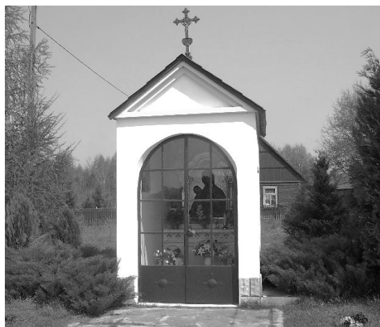
Kapliczka w Majdanie Zahorodyńskim

Od ponad pięciu lat ks. Kanonik mieszka w Hrubieszowie. W tej społeczności również nie jest znany. Nie odpowiemy na pytanie, ile jest w tym winy osób odpowiedzialnych za kreowanie polityki kulturalnej miasta, a ile niczym nieuzasadnionej skromności ks. Kanonika. Od dziesięcioleci jest osobą publiczną, stale aktywną piśmienniczo i duszpastersko. Niezależnie od przyczyn tę niemoc koniecznie trzeba przełamać. Jeżeli nie Horodło i nie Siedliszcze, to może Hrubieszów, najmłodsza mała ojczyzna Księdza, zatroszczy się o pamięć o Nim. Może to ona będzie właśnie ojczyzną, a nie syncyzną. Nie zapominajmy, że osobowy byt ludzki Ksiądz postrzega przez pryzmat chrześcijańskiej filozofii człowieka, podobnie dzieje narodowe, a nurt ten jest świadomie przemilczany przez zwolenników ponowoczesnych formacji kulturowych. Nie jest jednak tak, że nie możemy wyznaczyć należnego miejsca twórcom, którzy są wierni treściom konstytuującym nas jako naród. Jeżeli ktoś tak sądzi, to jest to wyraz swojej dezercji lub aksjologicznego zagubienia.