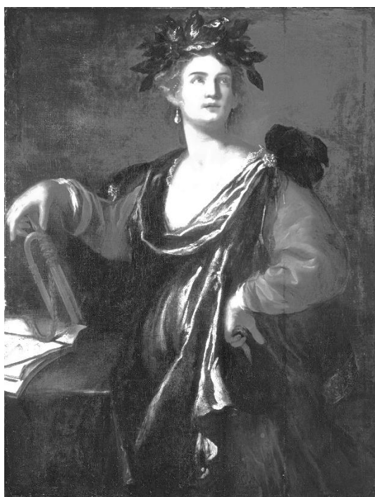
Artemisia Gentileschi, Klio muza historii, źródło: Wikipedia

znaczenie? Czy jest postrzegana jako konieczny, wymagany element edukacji? Czemu ma służyć? Czy pomaga funkcjonować w życiu codziennym? Jak pamięć historyczna wpływa na świadomość historyczną wspólnoty narodowej? I co z tego wynika lub może wynikać? Po co w ogóle potrzebna jest jakaś wiedza o czasie minionym? Czy wpływa to na stan państwa i poziom jego bezpieczeństwa? Czy jest jedynie częścią programów studiów historycznych, ewentualnie specjalistycznych, akademickich, seminaryjnych dysput? A może pamięć historyczna ma pełnić służebną rolę w polityce, a zwłaszcza w kreowaniu i budowaniu wpływu polityków i rządzących na społeczeństwo? Czy zauważalne są międzypokoleniowe różnice w pojmowaniu i posługiwaniu się pamięcią historyczną?