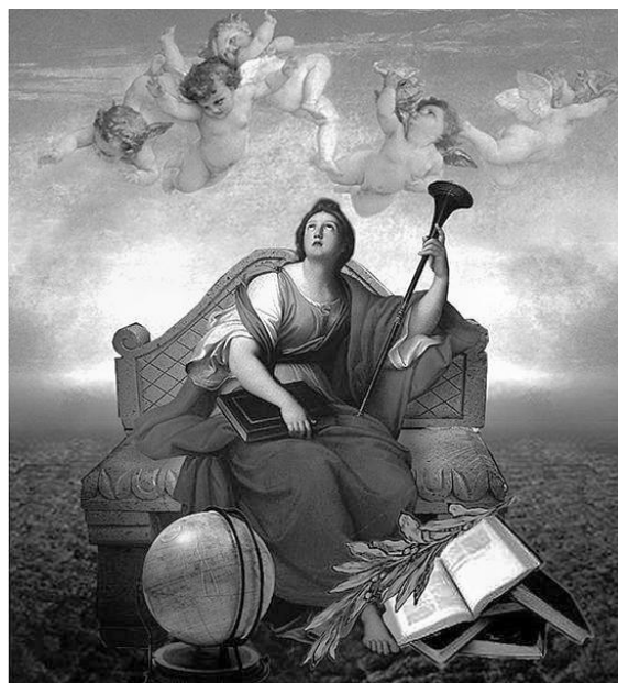
Pierre Mignard, Klio - muza historii

Ślubuje powinność. W pewnym sensie zostaje dłużnikiem państwa, które nie tylko go wykształciło, zatrudnia i wynagradza, ale także obdarza daleko idącym zaufaniem, skoro powierza mu młodzież, przyszłość narodu, jej świadomość, wrażliwość i sumienia. Nauczyciel nie jest zakładnikiem państwa czy kogokolwiek, ale człowiekiem zobowiązanym. Jest profesją zaufania publicznego, bo jego wpływ na ludzkie losy jest wyjątkowy. Iluż to nauczycieli wychowało wybitnych absolwentów i swoich następców!