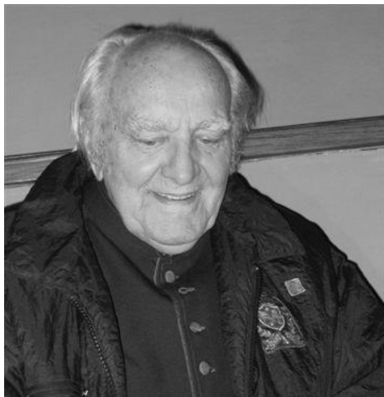
Ks. prałat Zdzisław Peszkowski