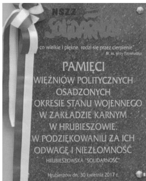
Tablica pamiątkowa na murze Zakładu Karnego w Hrubieszowie, źródło: Zjazd więźniów politycznych z lat 1982-1983 osadzonych w Zakładzie Karnym w Hrubieszowie , brak miejsca wydania, 2025