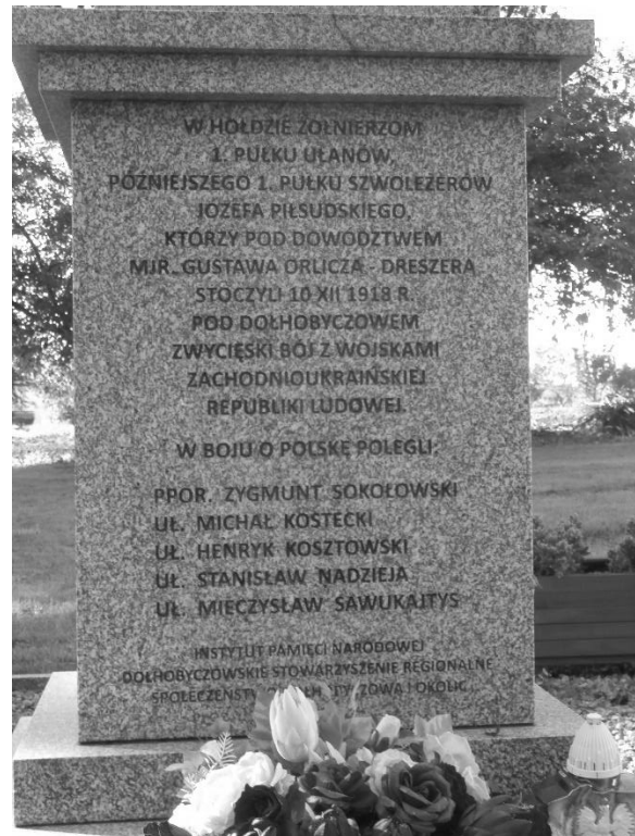
Postument pomnika. Nazwiska poległych ułanów pod Dołhobyczowem