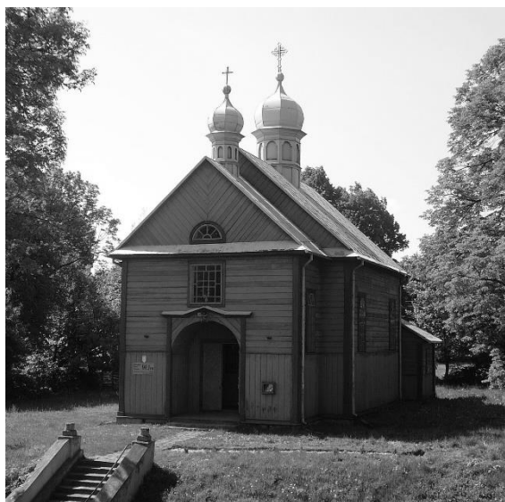
Świątynia neounicka w Horodle

Pana , Hrubieszów 2025; historię życia mieszkańców Majdanu Zahorodyńskiego zamieścił w: Opowieści , Hrubieszów 2025; historię krzyży i kapliczek, w tym przydrożnych z okolic Majdanu Zahorodyńskiego, w: Znaki wiary , Siedliszcze 2025. Będąc proboszczem parafii Horodło, prowadził interesującą stronę parafii, z bogatą problematyką historyczną. Niestety, ten materiał w stosownym czasie nie został wydrukowany, złożony w skoroszycie czy poszycie i archiwizowany. Przy kolejnej zmianie strony zapisy elektroniczne przestały istnieć. Jest to niepowetowana strata. Ksiądz posiada bogate zbiory ikonograficzne. Byłoby dobrze zdeponować je w jednej z bibliotek. Podpowiadamy, że najlepiej w Miejskiej Bibliotece Publicznej w Hrubieszowie bądź w Muzeum Regionalnym w Hrubieszowie. Ks. Kanonik ma niekwestionowany dorobek piśmienniczy, wzbogacający dziedzictwo kulturowe tej części kraju, Ojczyzny. Nie bez znaczenia jest fakt, iż sytuuje się on w nurcie myśli wyznaczanej chrześcijańską wizją świata i człowieka. Polską tożsamość kulturową konstytuują treści łacińskie, stąd nasza troska o ten nurt w piśmiennictwie. Jeszcze raz podkreślimy, że dzisiaj wielu nie chce go dostrzegać, świadomie lansując relatywizację każdej sfery życia. Musimy mieć odwagę przeciwstawić się tym trendom. Nikt nas nie zwolnił z tego obowiązku.