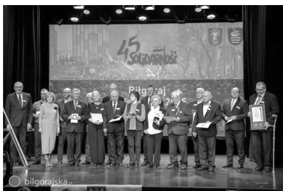
Pamiątkowe zdjęcie