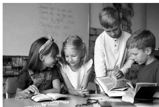
Zdjęcie poglądowe, źródło: pl.freepik.com

Jedno jest pewne, że wprowadzone zmiany od 1 września 2025 do szkół w Polsce stały się wizytówką z mocną ideologiczną podbudową