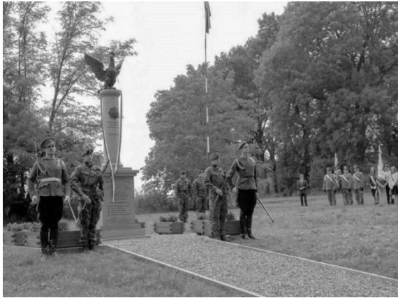
Warta honorowa przed odsłonięciem pomnika. W głębi poczty sztandarowe, źródło: dolhobyczow.pl

częściu walk o Lwów w listopadzie 1918 r. Ukraińcy skierowali w rejon Sokala, Bełża, Rawy Ruskiej oddziały osłonowe. Rozwinęły one linię ubezpieczeń od Bełżca poprzez Ulhówek, Waręż, Uhrynów po Litowież. Na początku grudnia