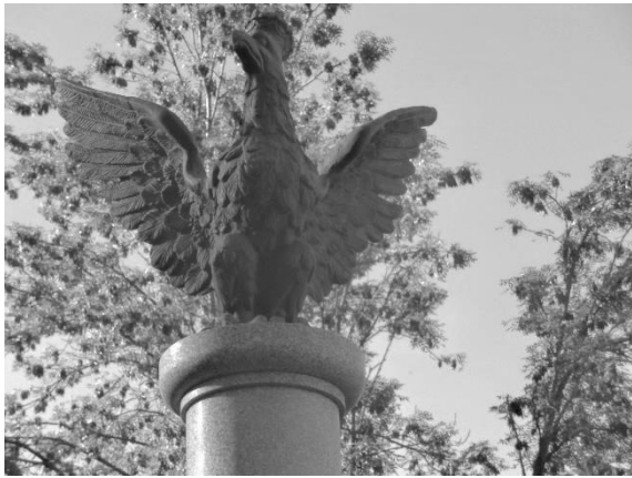
Zwieńczenie pomnika

Warszawie, istniejąca jeszcze wówczas Rada Ochrony Pamięci Walk i Męczeństwa, a także Urząd do Spraw Kombatantów i Osób Represjonowanych.