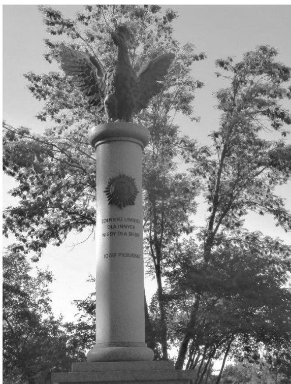
Górna część pomnika, fot. E. Wilkowski

Dziennika" - w boju pod Dołhobyczowem historyk (J. Tym - E.W.) również nie pozostawił miejsca na jakiegokolwiek wątpliwości, argumentując swoją opinię precyzyjną analizą przebiegu walki i podważając ustalenia Szankowskiego jako oparte na <nieznanych podstawach źródłowych>. Profesor J. Tym skonstruował: „Bój kombinowany szwadronu I Pułku Szwoleżerów został stoczony 10 grudnia 1918 roku i był bojem zwycięskim dla strony polskiej”. Tezę L. Szankowskiego przyjął za „informację błędną”. Dołhobyczowskie Stowarzyszenie Regionalne przesłało stanowisko profesora J. Tyma do lubel-