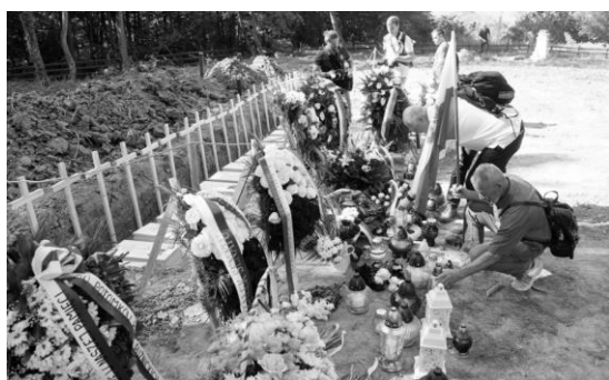
Zbiorowa mogiła pomordowanych w Puźnikach

będzie „padał na kolana” przed Kijowem, wykonywał gestów zgodnie z oczekiwaniami Ukraińców. Nie łudźmy się, wobec naszego prezydenta uruchomiona zostanie olbrzymia machina nacisku. Zresztą ten proces już się rozpoczął. Na łamach proukraińskich portali, w tym „Gazety Wyborczej”, pisze się, że Kijów zaprasza, a K. Nawrocki nie reaguje, że z tego powodu w Kijowie jest konsternacja, że stanowisko polskiego prezydenta służy jedynie Moskwie. Są to mocne argumenty. „Mimo wyraźnych zaproszeń od prezydenta Wołodymyra Zełenskiego – akcentował dziennikarz gazety.pl w ostatnich dniach października 2025 r. - prezydent Karol Nawrocki nie zamierza odwiedzić Kijowa. Ta sytuacja budzi zaskoczenie i rodzi pytania o kie-