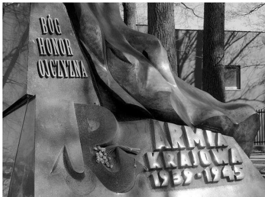
Pomnik Armii Krajowej w Sopocie

Nauczyciel ślubuje „dążyć do pełni rozwoju osobowości ucznia i własnej”. Rozwój musi być zrównoważony i musi obejmować całą osobowość. Musi być także, a właściwie przede wszystkim, rozwojem moralnym. Wedle arystotelesowskiej koncepcji wychowanie miało polegać na rozwijaniu cnót moralnych i intelektualnych poprzez dążenie do złotego środka, czyli do umiaru i opanowania. Pomnażanie „niehumanicznych geniuszy”, „chłodnych intelektualistów” czy „bezdusznym ekspertów” nie służy społeczeństwu. Cnoty, czyli sprawności moralne, czynią człowieka dojrzałym i odpowiedzialnym za siebie i za innych.