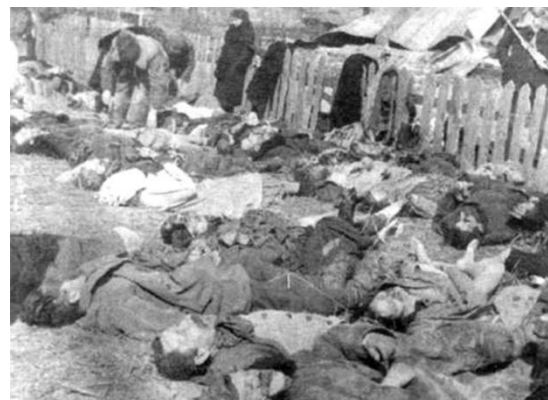
Zamordowani Polacy w Lipnikach, źródło: Wikipedia

na ile za polskiej prezydencji w UE posuną się negocjacje akcesyjne z Ukrainą. Nie możemy wykluczyć, że pobratymcy będą się zmagali z innymi problemami: z sytuacją na froncie, ze słab-