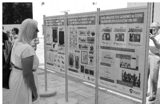
Otwarcie wystawy, 24 lipca 2024 r.