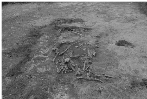
Masowa mogiła pomordowanych Polaków w Woli Ostrowieckiej

przyjęciu Ukrainy do Unii. Polski minister stanowisko to określił jako „nierealne”. Powyższe fakty w relacje polsko-ukraińskie „wniosły niepokój”. Wypowiedzi polskich polityków, wśród nich Władysława Kosiniaka-Kamysza, Marka Sawickiego, Pawła Kukiza, Kijów przyjmował z „głębokim rozczarowaniem”. Warszawa milczeniem przyjęła także żądania Związku Ukraińców w Polsce dotyczące demontażu pomnika w Domostawie.