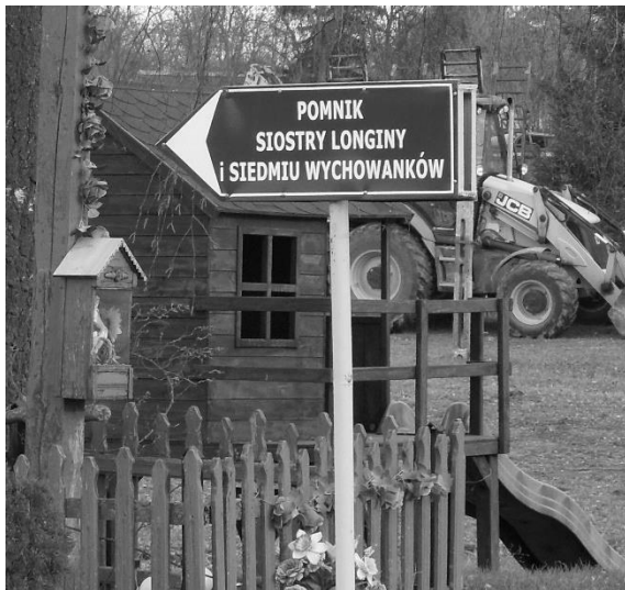
Znak przy drodze z Sahrynia do Modrynia, wskazujący miejsce morderstwa

dzień wzrastała w gorliwości, ofiarności i pokorze. Wykazywała wysoki stopień umartwienia miłości własnej, który uwidaczniał się w przyjmowaniu zarzutów, uwag i przykrości. Siostra Longina nigdy się nie usprawiedliwiała. Czasami na obronę były tylko łzy. Zadawała sobie różne umartwienia. Zawsze była skupiona, ze wzrokiem opuszczonym, prawą ręką trzymała krzyżyk zawieszony na piersiach. Pomimo takiego skupienia postrzegano ją jako osobę wesołą i przystępną. Modlitwa była źródłem, z którego Longina czerpała siły, by prowadzić intensywne życie wewnętrzne i bezbłędnie wypełniać swoje obowiązki. Kontakt z jej Mistrzem, Jezusem Chrystusem, z Matką Przenajświętszą oraz z patronem, świętym Andrzejem Bobolą, dawał jej siłę do wypełniania ślubów zakonnych, do przestrzegania reguły i przestrzegania cnót chrześcijańskich.