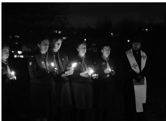
Obrzęd Fiat, fot. 2. Hufiec Chełmski

rozwijaniem się ruchu skautowego jeszcze przed odzyskaniem niepodległości przez Polskę, w dwudziestoleciu międzywojennym czy z