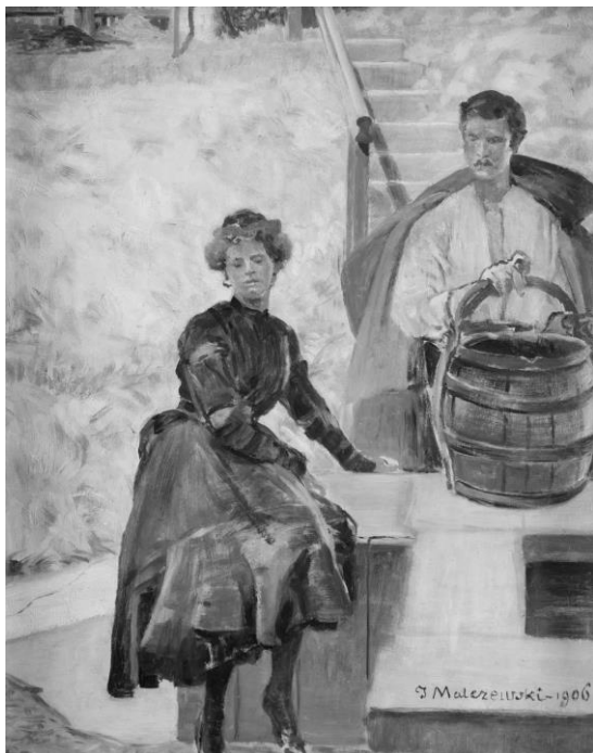
Jacek Malczewski, Zatruta studnia, 1906

towarzystwie dwóch kobiet. W ręku trzyma gli-niany garnek z wodą, w której jest ropucha. Jej pojawienie się wywołało uśmiech na twarzach kobiet-strażniczek. Woda nie nadaje się do picia. Zrezygnowany starzec patrzy na naczynie z żabą. W 1906 r. malarz ukazał kobietę w syberyjskim szynelu i w jakuckiej czapce. Swoim strojem przypomina Ellenai, bohaterkę dramatu J. Słowackiego. Usiadła na cembrowinie studni. Zaplata warkocz. Obok stoi wiadro. W tle zimowy krajobraz, charakterystyczny dla Syberii. Obrazem tym artysta powraca do wcześniejszych prac o tematyce martyrologicznej. Zatrzymajmy się jeszcze nad obrazem z 1906 r. Przed studnią stoi młody mężczyzna w narzuconym na plecy syberyjskim szynelu i w rozpiętej koszuli. Prawą rękę trzyma na uchwycie wiadra, wspartego na obudowie studni. Patrzy na sie-