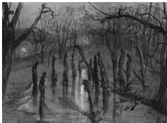
Stanisław Wyspiański, Chochóły, 1898

Drugą wadą, którą warto się zająć, jest prowadzenie jałowych dyskusji, w których wszyscy coś mówią, ale nikt nikogo nie słucha. Wygląszamy tyleż śmieszne co płomienne monologi, upieramy się przy swoich racjach, absolutyzujemy swoje przekonania odległe od prawdy, a nawet dalekie od zwykłej racjonalności. W dramacie Wyspiańskiego są niezwykle celne stwierdzenia: „Wyście sobie, a my sobie, Każden sobie rzepkę skrobie” (Radczyni do Kliminy), „Każden ogień swój zapala, każden swoją świętość święci?” (Gospodarz do Poety), „A, jak myślę, że panowie dużo by już mogli mieć, ino oni nie chcom chcieć!” (Czepiec do Dziennikarza). I może najbardziej dramatyczny osąd: „Wina ojca idzie w syna; niegodnych synowie niegodni; ten przeklina, ów przeklina - ród pamięta, brat pamięta, kto te pozakładał pęta i że ręka, co przekłeta, była swoja” (Dziennikarz do Stańczyka).