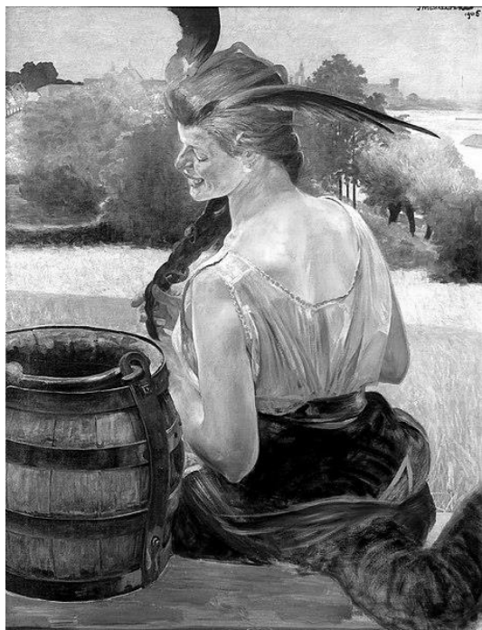
Jacek Malczewski, Zatruta studnia z chimerą , 1905

Przypomina korony pierwszych Piastów znanych z Pocztu Królów i Książąt Polskich Jana Matejki, wielkiego narodowego historiozofa. Tym zabiegiem J. Malczewski spina klamrą narodowe dzieje odradzającej się Ojczyzny. Zmartwychwstanie Polski nie przyszło jednak bez ofiar. Polonia obmywa z krwi poranione dłonie. Pomimo wielu odniesień do cierpień z przeszłości Polonia nie sprawia wrażenia zmęczonej, wycieńczonej. Delikatnie się uśmiecha z nieskrywana dumą i wręcz z kobietą czułością. Jest młoda i silna, pełna witalności, gotowa do nowego życia. Siedzi na schodach w ogrodzie, odradza się niczym jej otoczenie na wiosnę. Popatrzmy na tło obrazu. Na szczycie schodów widoczne są nogi postaci z zerwanymi kajdanami. Jest to znak powrotu z zesłania, w szerszym rozumieniu - uosobienie wyzwolenia narodu. Po prawej stronie Polonii malarz wprowadził jeszcze jeden znak syberyjski: kwiat czosnku syberyjskiego. Motyw ten pojawia się na wielu obrazach J. Malczewskiego.