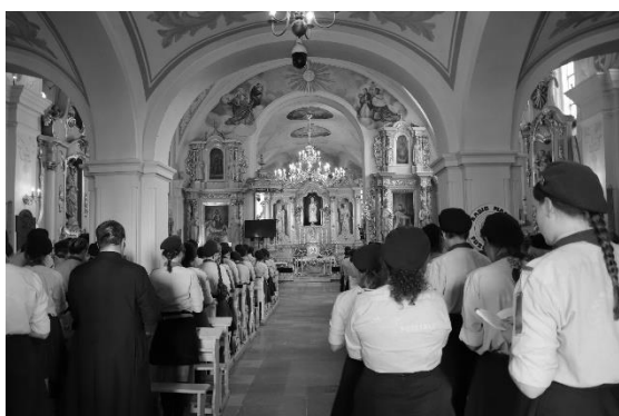
Bazylika w Górcie Klasztornej - nabożeństwo i śpiew akatysty

cięższych walk to właśnie śpiew Mazurka Dąbrowskiego dodawał odwagi. Jeśli już jesteśmy przy tej bitwie, warto wspomnieć scenę z serialu Dom , a mianowicie kiedy Basia Lawinówna pijana próbuje zaciągnąć do tańca swojego towarzysza do melodii Czerwone maki na Monte Cassino , powstaje oburzenie w lokalu z tego powodu i padają znamienne słowa: Tego się nie tańczy. Józef Piłsudski o Pierwszej Brygadzie powiedział natomiast, że jest to najdumniejsza polska pieśń. Można by te przykłady jeszcze długo mnożyć. W skali mikro dla jednostki te utwory przyjmują charakter sentymentalny, a czasem fundamentalny dla epoki, twórcy czy słuchacza. Bo kto z nas nie ma takich utworów, których mógłby słuchać godzinami, które nie poruszają serca, które dla nas są naprawdę ważne z różnych względów? Dlaczego o tym piszę i wspominać? W cyklu poświęconym Prawu Harcerskiemu dowiedzieliśmy się, że harcerz i harcerka śpiewają w kłopotach. Muzyka jest istotnym elementem harcerskiego życia. W tym tekście chciałbym w sposób zupełnie subiektywny przedstawić pieśni i piosenki harcerskie, które zasługują na uwagę Czytelnika. Bo to nie tylko frywolne pioseneczki o stokrotce i gapowatym harcerzu.