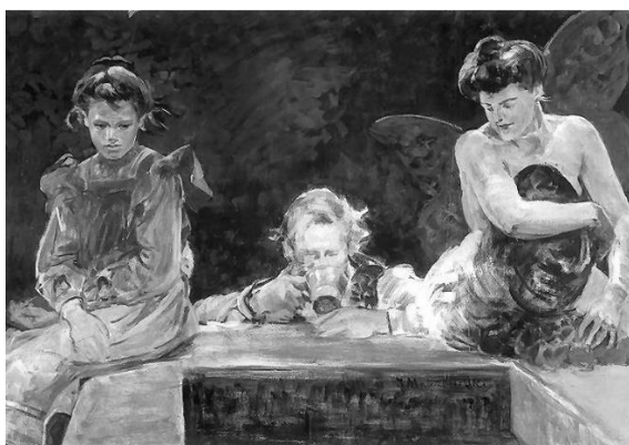
Jacek Malczewski, Zatruta studnia