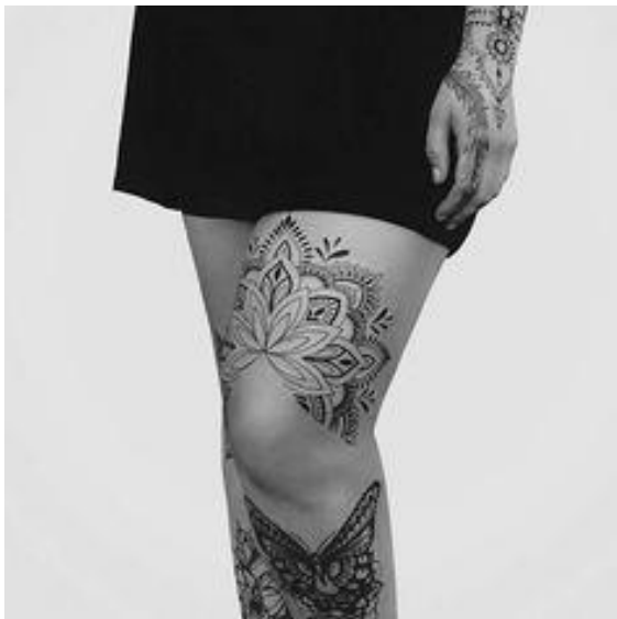
Tatuaże na nogach i ręce dziewczyny

była jego osobista decyzja czy narzucona przez kogoś? Papież chciał czy musiał być w totalnej izolacji? Wszechobecny strach na wszystkich rzucał swój monstrualny cień.