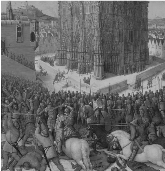
Oblężenie Jerozolimy przez wojska Nabuchodonozora II, ilustracja z Antiquites Judaïques, s. 1470

Jeruzalem upada i Juda się wali, bo przeciw Panu są ich słowa i czyny, by oczy Jego chwały obrażać. Stronniczość ich świadczy przeciw nim, jak Sodomia ogłaszają swój grzech, nie ukrywają go. Biada im, bo sami gotują sobie nieszczęście. [...] Ach, mój lud! Młokos go ciemięży i kobiety nim rządzą. Ludu mój! Przywódcy twoi cię zwodzą i burzą drogę, którą kroczysz”.