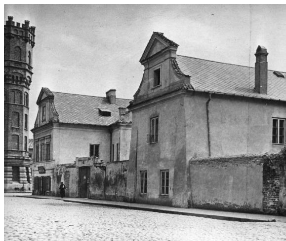
Oficyny popiarskie - od 1939 r. siedziba Biblioteki

zbiory wartościowe i cenne dla dziedzictwa narodowego, unikatowe i mające dużą wartość historyczną, naukową, kulturalną lub artystyczną, podlegają one szczególnej ochronie.