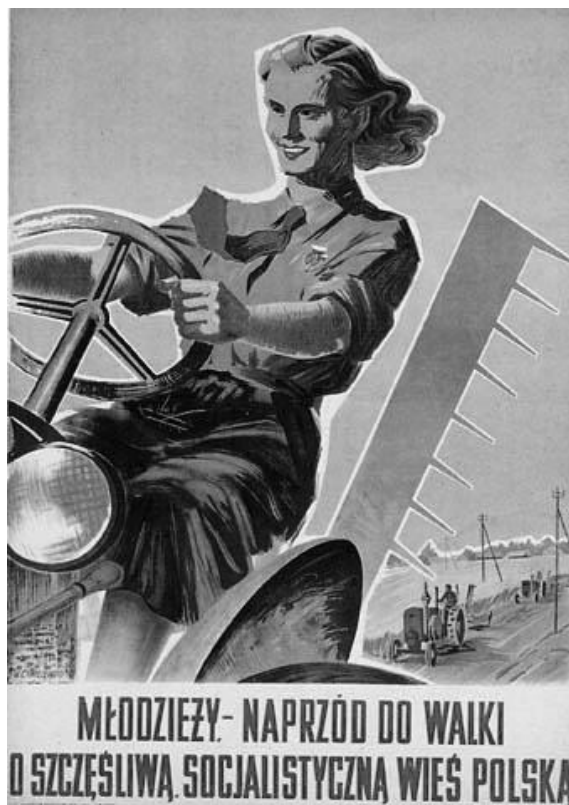
Plakat propagandowy, kobieta na traktorze

sens i zakres przyjętych form ekspresji. Za bezsporne przyjąć należy, że one, wprowadzane w dialogi kolejnych postaci, wyostrzają ich wypowiedzi. I w tej pracy czytelne stają się Jego doświadczenia jako poety, z olbrzymią paletą wykorzystywanej metaforyki. Ponadto Autor po mistrzowsku wykorzystuje język ideologii doby stalinowskiej, szerzej, okresu komunizmu w Polsce, wręcz kpiąc z niego, ukazując go w ostrym, satyrycznym przekazie, demaskując ówczesny system polityczno-społeczny. Zależy