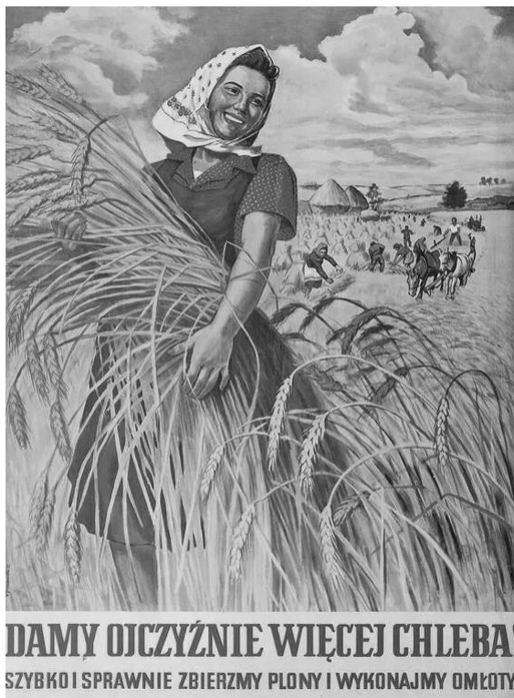
Plakat propagandowy

stawiania młodzieńczych pytań, w dociekaniu, a nie przyjmowaniu wszystkiego na zasadzie a priori (np. że na wierzbie będą dojrzewały gruszki). Nie bez znaczenia pozostawały wartości wyniesione z domu rodzinnego, przywiązanie do wiary ojców. Zapłacili za to wysoką cenę, uwięzienia, przerwania nauki.