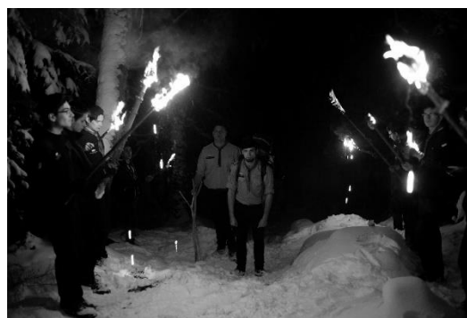
Obrzęd Wymarszu, arch. Skauci Europy

„Żeglujmy tam, gdzie wiatr kołysze fale, Maryjo, gwiazdo wszystkich mórz, Królowo nieba strzeż naszych dróg, latarnio morska światłem swym prowadź, w ciemnościach burz rozjaśnij cel”.