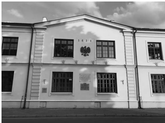
Gmach LO im. J. I. Kraszewskiego, dawna Akademia Bialska