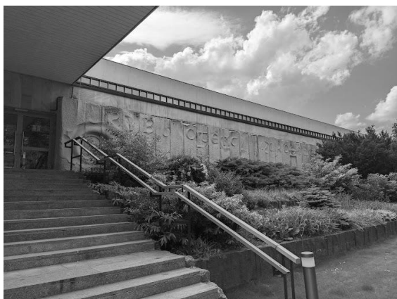
Biblioteka Narodowa, źródło: Wikipedia

Obojga Narodów. W okresie zaborów rolę tę pełniły Biblioteka Jagiellońska i Zakład Narodowy im. Ossolińskich we Lwowie.