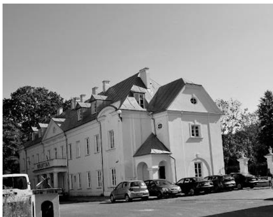
Gmach Biblioteki, stan obecny, źródło: Wikipedia

przez bibliotekę i Muzeum Południowego Podlasia, konkursów o charakterze regionalnym. Dzięki zgromadzonym zbiorom łatwiej jest napisać artykuł czy książkę. Dział Wiedzy o Regionie ma swój udział w powstawaniu wielu regionalnych publikacji. Przykładem może być wyjątkowa monografia Dzieje Białej Podlaskiej .