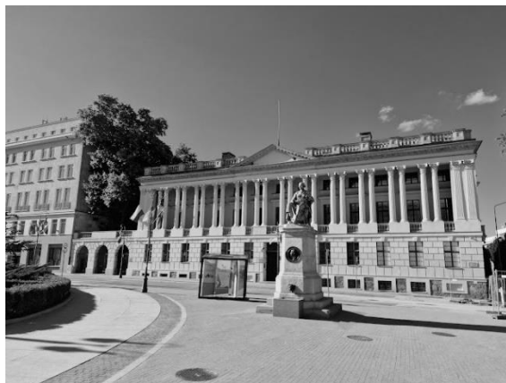
Biblioteka Raczyńskich w Poznaniu

Fundacja Zakładu w Polsce została restytuowana w 1995 r., a w 1997 ponownie utworzono Muzeum Książąt Lubomirskich. Patronat nad Ossolineum sprawuje prezydent RP. Niestety, Bibliotece tej nie przysługuje egzemplarz obowiązkowy, co wyraźnie pomniejsza jej status. Nie przywrócono jej również statusu biblioteki narodowej. I to są już znaki czasu dokonywane przez władze państwowe III RP.