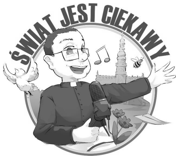
Logo audycji Katolickiego Radia Zamość

myśli i nauczania skierowanego do ludzi kultury. Szczególnie znaczący jest List do Artystów , opublikowany przez św. Jana Pawła II 4 kwietnia 1999 r. Po Mszy św. odbywają się wieczory autorskie, a następnie nieformalne spotkania