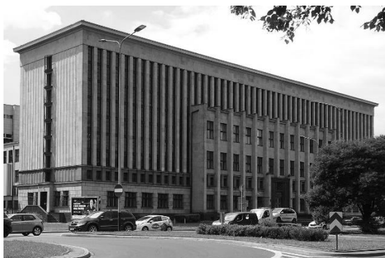
Gmach Biblioteki Jagiellońskiej

Jedną z najstarszych bibliotek w Polsce jest Biblioteka Jagiellońska. Jej początki związane są z historią Uniwersytetu Jagiellońskiego, stąd za datę utworzenia przyjmuje się rok 1364 (Akademia Krakowska). Kodeksy używane w XIV wieku zachowały się do dnia dzisiejszego. Przez długi okres zbiory biblioteczne uniwersytetu gromadzone były przy wydziałach, kolegiach, bursach studenckich. Największy zbiór znajdował się przy Collegium Maius, najstarszym budynku odnowionej Akademii Krakowskiej (należący do niej od 1400 r.). Po rozbudowie i odbudowie na przełomie XIV i XV wieku Collegium stało się siedzibą biblioteki. W XVI stuleciu zbiory jej szybko się powiększały. W dobie prac Komisji Edukacji Narodowej ks. Hugo Kołłątaj polecił połączyć rozproszone księgozbiory i utworzyć jedną bibliotekę ogólnouniwersytecką