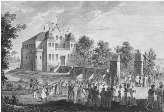
Kórnik w czasach Białej Damy, ryc. G. Doeblera

został ukarany konfiskatą majątku. Po wygranym procesie o sekwestr dóbr powrócił do Wielkopolski, gdzie osiadł w Kórniku. Za jego sprawą majątek zmienił nazwę z formy „Kurnik” na „Kórnik” – intencją wprowadzenia litery obcej w alfabecie niemieckim było zapobieżenie zmienieniu nazwy.