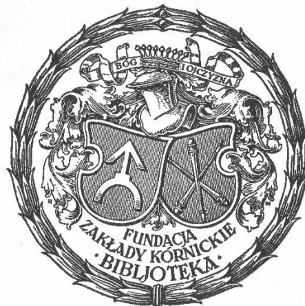
Ekslibris Biblioteki Zakładów Kórnickich 1926

w perspektywie sprowadziło na bibliotekę poważne kłopoty finansowe - w dwudziestolecie międzywojennym Fundacja borykała się z efektami kryzysu lat 1929-1935.