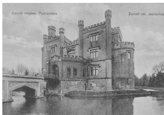
Gmach Biblioteki od Zachodu