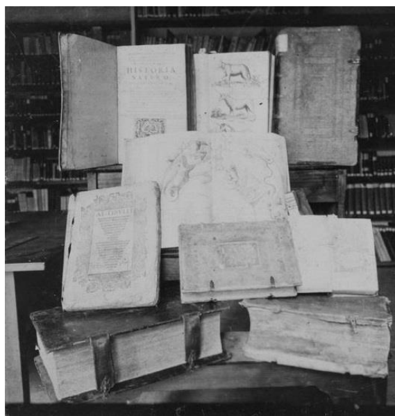
Rękopisy i stare druki ze zbiorów Biblioteki Kórnickiej, 1908 r.

humanistyki oraz w upowszechnianiu dziedzictwa narodowego.