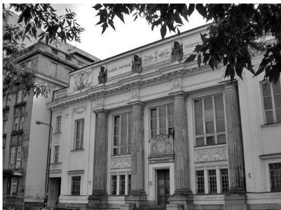
Budynek dawnej Biblioteki Ordynacji Krasieńskich