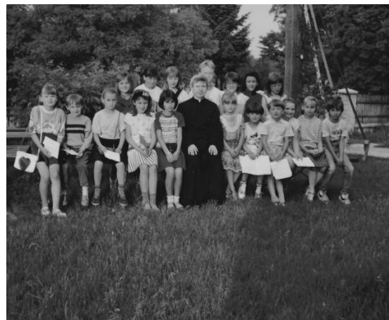
Żmudź, ks proboszcz z dziećmi.

Parafianie z wielkim oddaniem angażowali się też w ożywienie i pogłębienie swojej wiary. Licznie gromadzili się na Mszach św. i uroczystościach związanych z Rokiem Liturgicznym. Ks. Proboszcz swoją otwartością i życzliwością oraz ciepłym słowem sprawił, że przybywało wielu chętnych chłopców do posługi ministranckiej. Młodzież i dzieci z radością przychodziły na nabożeństwa majowe i różańcowe.