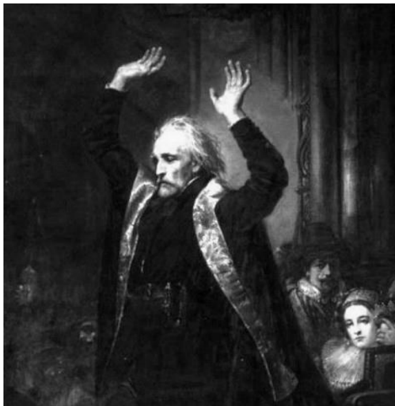
Jan Matejko, Kazanie Skargi (fragment)

rozbicia dzielnicowego (XII-XIV w.) polski Kościół zachował stałą i jednolitą strukturę zarządzaną przez arcybiskupa gnieźnieńskiego, co stanowiło ważny element podtrzymywania historycznej więzi i jedności ziem polskich. Biskupi, którzy spotykali się na synodach, czyli diecezjalnych zjazdach, dostrzegali znaczenie zjednoczenia dawnej monarchii piastowskiej, popierali więc i aktywizowali działania zmierzające w tym kierunku. Kościół budował wśród wiernych poczucie wspólnoty i przywiązania do zjednoczonej ojczyzny.