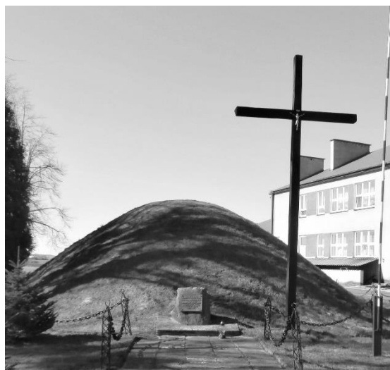
Kopiec Marszałka Józefa Piłsudskiego w Wołkowie, w 1941 r. zniszczony przez Rusinów-Ukraińców. Ponownie został usypany po 1991 r., przy wsparciu ks. proboszcza