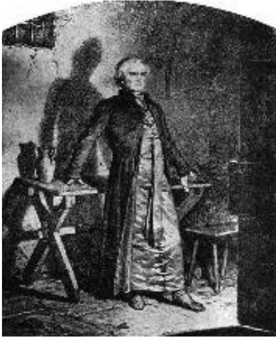
Artur Grottger, Więzienie księdza

czasu był ks. Stanisław Brzóska (1834-1865), więziony przez Rosjan, naczelny kapelan wojsk powstańczych na południowym Podlasiu, stracony na szubienicy po upadku powstania. Inną wybitną postacią czasu przełomu wieków XIX i XX był ks. Piotr Wawrzyniak (1849-1910), działacz społeczny, gospodarczy i oświatowy w zaborze pruskim, nazwany „niekoronowanym królem polskim”, który był faktycznym przywódcą politycznym i duchowym Polaków w całym zaborze.