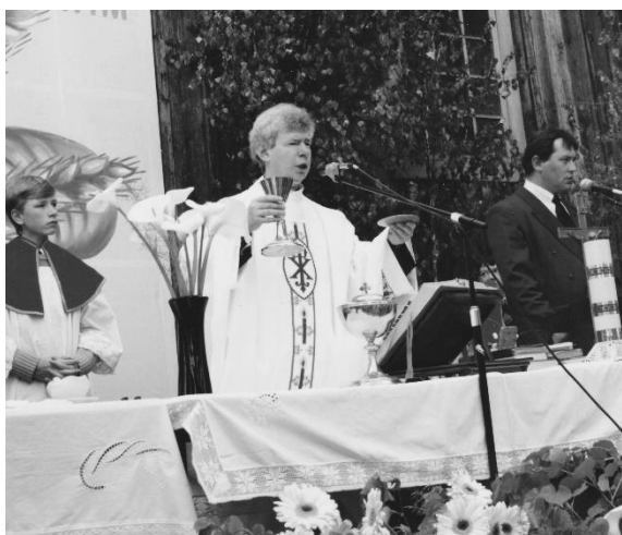
Żmudź. Ks. proboszcz odprawia Mszę św. na placu przykościelnym.