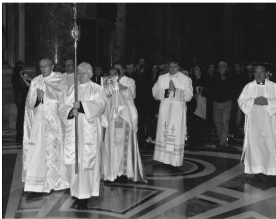
Ks. proboszcz na czele procesyjnego wejścia do Bazyliki Św. Piotra.