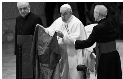
Papież Franciszek przed ucałowaniem flagi ukraińskiej

tości, a ewidentne błędy antropologiczne przyjmując za wyrazy wolności. W imię doraźnych dążeń można dopuszczać się profanacji katolickich świątyń, obrażać uczucia chrześcijan, ale tylko ich. Wierni innych religii muszą być strzeżeni i chronieni. I przy tych znakach czasu wielu, za główny wyraz rzekomego wyzwolenia człowieka, przyjęło niezrozumiałe założenie sprowadzające się do odrzucenia porządku łacińskiego. Nie udawajmy, że tego procesu nie ma lub że my w nim nie uczestniczymy. I w tym miejscu zapytajmy o przyczyny defensywnej postawy tej części inteligencji, która identyfikuje się z klasycznymi rozważaniami o człowieku.