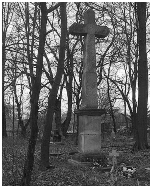
Pomnik nagrobny kapłana unickiego ks. Platona Laurysiewicza na cmentarzu pounickim w Sahryniu (przed zniszczeniem).

dali w konfesjonałach w cerkwi unickiej i odwrotnie. W nowej sytuacji wielu mieszkańców tych ziem w wieku 60 lat i powyżej dowiadywało się nagle, że są prawosławnymi. Strona rosyjska powoływała specjalne komisje złożone z