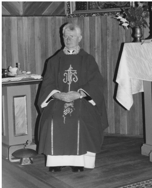
Świątynia w Żmudzi. Ks. proboszcz w charakterze celebrysa-gościa.

Wiadomość o niespodziewanym przeniesieniu kochanego Pasterza napelniła serca parafian smutkiem, popłynęły łzy podczas pożegnania. Wszyscy dziękowali za wielkie oddanie i posługę w parafii. Obecne były również Rada Duszpasterska i delegacje z instytucji gminnych.