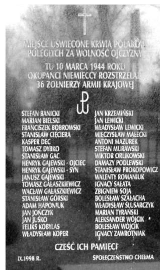
Tablica pamiątkowa w miejscu publicznej egzekucji 36. żołnierzy AK na tzw. Targowicy - Chełm, mur okalający cmentarz parafialny przy ul. Lwowskiej od strony al. Armii Krajowej (1998 r.).