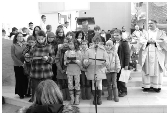
Msza św. z asystą uczestników oazy

miejsca spotkań przy nowym ośrodku duszpasterskim, stąd organizował je w ówczesnym miejscu swojego zamieszkania, na plebanii parafii p.w. Rozesłania Świętych Apostołów. W taki oto sposób rozpoczął swoją działalność przy parafii Chrystusa Odkupiciela ruch oazowy i działa po dzień dzisiejszy.