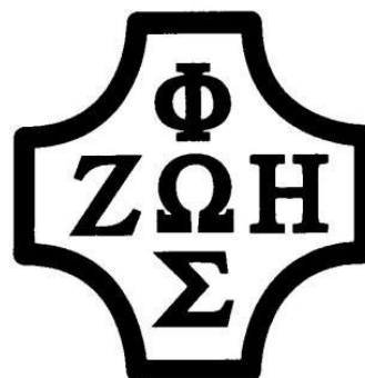
Foska - symbol Ruchu Światło-Życie

zówka, drogowskaz. To Słowo chce rozbłysnąć jako światło dla naszej woli, postępowania, życia. To właśnie ono przenika nasze życie. W samym centrum owego krzyża jest grecka litera omega (Ω) oznaczająca Ducha Świętego. Dzięki niemu życie staje się światłem, a światło-życiem. Ten oazowy znak wyraża ideał chrześcijańskiej dojrzałości, który polega na życiu zgodnym w wolą Bożą oraz nieustanne pragnienie dążenia do stawania się „Nowym Człowiekiem”.