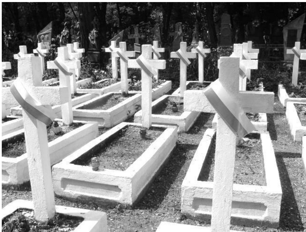
Cmentarz w Zasmykach