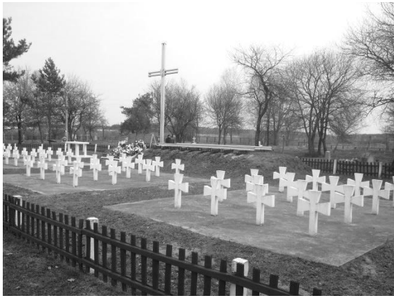
Cmentarz wojenny w Rymaczach