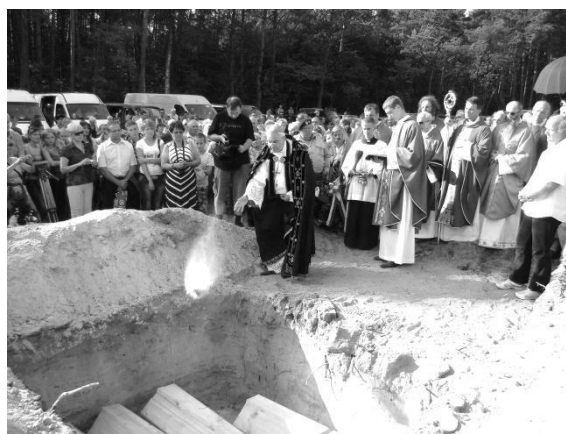
Msza św. pogrzebowa w Ostrówkach

Należy też pamiętać, iż z rąk OUN - UPA zginęło ok. 40-60 tys. Ukraińców, w tym ok. 30 księży greckokatolickich (Małopolska Wschodnia, Wołyń, Polesie) oraz ok. 20 duchownych prawosławnych (na Wołyniu). Ginęli nie tylko Polacy, ale również Czesi, Rosjanie, Węgrzy, Żydzi, Ormianie, potomkowie Holendrów... Ginęli za odmowę wstąpienia do UPA, za okazaną pomoc Polakom, za krytykę działań OUN - UPA, za bycie „obcym” na ukraińskiej ziemi. Jednak setki Polaków ocalało dzięki „sprawiedliwym Ukraińcom”, którzy ratowali polskich sąsiadów z narażeniem swojego życia. To niezwykle ważne i godne najwyższego uznania.