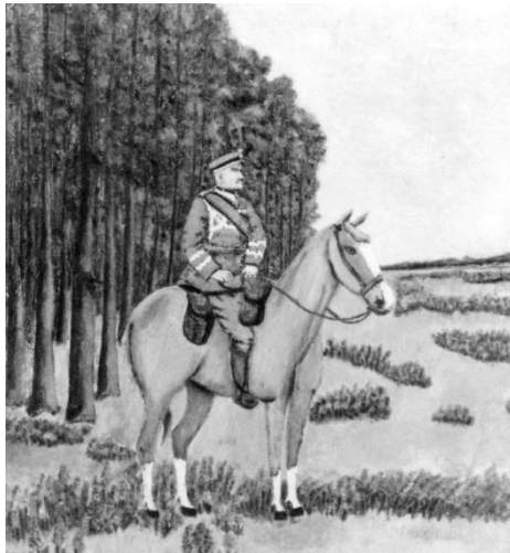
„Józef Piłsudski”.

Jej obrazy powstawały z wielkiego zainteresowania kulturą chłopską, z rodzinnych tradycji, własnych przeżyć i obserwacji świata, w którym się jest głęboko zakorzenionym. Zderzenie świata z rzeczywistością otaczającą artystę daje inny wymiar jego twórczości. W każdym przypadku jest to droga indywidualna, nie wymyślona sztucznie.