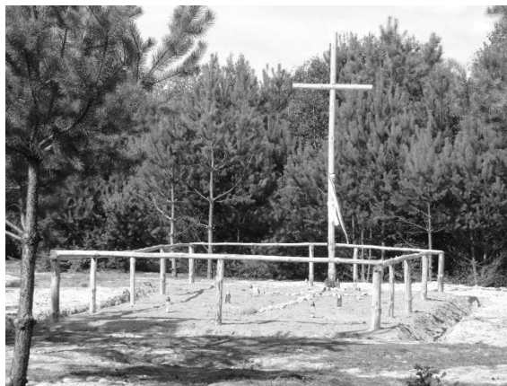
Zbiorowa mogiła w Ostrówkach