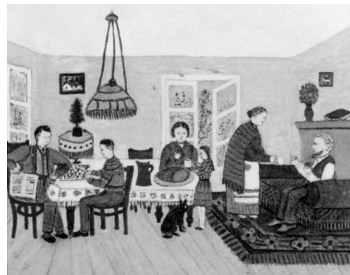
„Rodzina”.