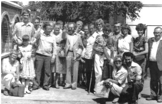
Przy kościele pw. Św. Kazimierza (5 sierpnia 1984 r.)

ktos mnie dzisiaj przekonuje, że w solidarnościowym podziemiu był aktywny, a śladów jego działalności nie ma w dokumentach SB dlatego, że potrafił ukryć swoje działania, to ja po prostu nie wierzę. Chyba że – po latach – prężną działalnością nazywa fakt tajemnego otrzymania, czy przekazania zaledwie kilka ulotek. Tak, taki zakres wymykał się spod kontroli. Jeden z funkcjonariuszy SB z Zamościa, charakteryzując postawę jednego ze swoich figurantów, napisał, że jedyną jego działalnością – na przestrzeni kilku lat – był udział w kilku Mszach św. „intencjonalnych”. Zawarł w tym klarowną ocenę, której dzisiaj były figurant nie może zrozumieć. Każda szerzej podjęta praca podziemna, bez specjalnego wydzielenia, konkretnego podporządkowania, znalazła odbicie w dokumentach, w różnej formie, chociażby w charakterze osób podpadających pod kontrolę (znam osoby, które takową kontrolą zostały objęte dopiero w 1989 r.). Jeżeli potem zniszczony został kwestionariusz ewidencyjny, w ramach którego dana osoba była kontrolowana, czy dokumenty spraw operacyjnego sprawdzenia, czy rozpracowania (pomijam sprawy śledcze), to odpryski pozostały w sprawach obiektowych, lub w dokumentach kontroli innych osób. Oczywiście, biorąc do ręki dokumenty aparatu bezpieczeństwa koniecznie trzeba je wprzęgnąć w mechanizmy krytyki źródła. Literalne odczytywanie ich prowadzić może na manowce, czego często jesteśmy świadkami.