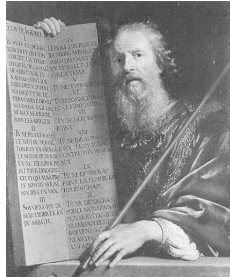
Thilippe de Champaigne „Mojżesz”

nie jest Bogiem samotnym. Jest wspólnotą osób, które nieodwołalnie się kochają i które sobie bezwarunkowo ufają. To jedna z najtrudniejszych prawd wiary, wobec której nawet najtęższe umysły teologiczne pozostają bezradne. Jak zrozumieć Jednego Boga w Trzech Osobach? Kim, jednak, byłby Bóg, gdyby nie pozostawał tajemnicą?