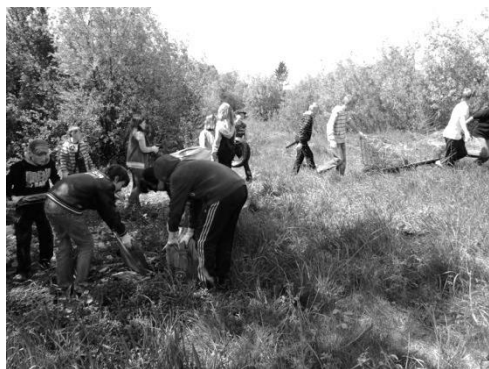
Likwidacji dzikiego składowiska w Chełmskim Parku Krajobrazowym.

W dniach 13-14 maja 2013 r. odbyła się kolejna akcja organizowana z okazji Światowego Dnia Ziemi „Odśmiecanie Krajobrazu 2013”. To już trzecia edycja „Odśmiecania Krajobrazu” – akcji organizowanej przez Zespół Lubelskich Parków Krajobrazowych Oddział Terenowy Chełm, która ma na celu uświadomienie społecznościom lokalnym problemu dzikich składowisk odpadów na obszarach chronionych. Efektem poprzednich edycji była likwidacja dzikich składowisk odpadów w gminie Rudahuta (na terenie Chełmskiego Parku Krajobrazowego), Kamień (na terenie Chełmskiego Obszaru Chronionego Krajobrazu).