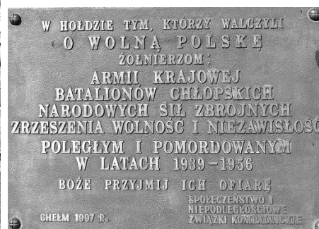
Pomnik-Grób Symboliczny żołnierzy organizacji niepodległościowych polskiego podziemia: AK, BCh, NSZ, Zrzeszenia „WiN” (1939-1956) – Chełm, cmentarz parafialny przy ul. Lwowskiej (1997 r.).