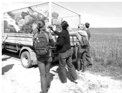
Zaladunek odpadów na półciężarówkę (Fot. Małgorzata Kazimierczak).

Tym razem na celownik wzięliśmy dzikie składowisko odpadów w gminie Dorohusk położone przy unikatowych w skali Europy torfowiskach węglanowych zlokalizowanych w Chełmskim Parku Krajobrazowym. W akcji uczestniczyła nie tylko młodzież ze szkół podstawowych w gminie Dorohusk, ale także wolontariusze z firmy Cemex Polska, Przedsiębiorstwa Gospodarki Odpadami, Miejskiego Przedsiębiorstwa Gospodarki Komunalnej i Urzędu Gminy Dorohusk. Akcja tym razem składała się z dwóch części: teoretycznej i praktycznej. Pierwszego dnia młodzież z gminy Dorohusk zapoznała się z największymi instalacjami ochrony środowiska w regionie znajdującymi się w Zakładzie Przetwarzania Odpadów Komunalnych w Srebrzyszczu, Cementowni Chełm i oczyszczalni ścieków.