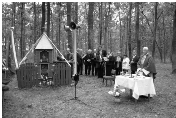
Msza św. przy kapliczce w Podchyliniu