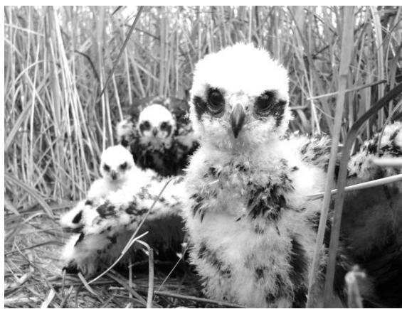
Młode błotniaki stawowe

objętymi ochroną rezerwatową. Osobliwością Sobiborskiego Parku Krajobrazowego jest żółw błotny – gatunek zagrożony wyginięciem, którego populacja jest tu największa w Europie Środkowej. Na terenie parku występuje także bardzo rzadka reliktozna ryba: strzebla przekopowa, wilki oraz szczególnie liczne żmije zygzakowate, zaskrońce i padalce. Spośród wielu gatunków ptaków na uwagę zasługują: puszczyk mszarny, którego pierwszy lęg w kraju stwierdzono w 2010 r. właśnie na tym obszarze, włochatka (drugie na Lubelszczyźnie stanowisko występowania tej sowy), bielik i gągoł – kaczka gniazdująca w dziuplach nadbrzeżnych drzew.