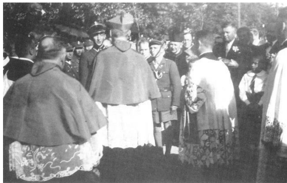
Biskup lubelski Stefan Wyszyński w czasie wizytacji parafii w Chełmie – 6 lipca 1946 r.

nieboskłon wykonany w technice metaloplastyki, tak modnej w latach 50 – tych i 60- tych. Charakter pracy dobrze zharmonizowany został z barokową ideą architektury kościoła. Taka wersja została zrealizowana i niewątpliwie świątynia rozbłysła nowym blaskiem w przenośni i dosłownie.