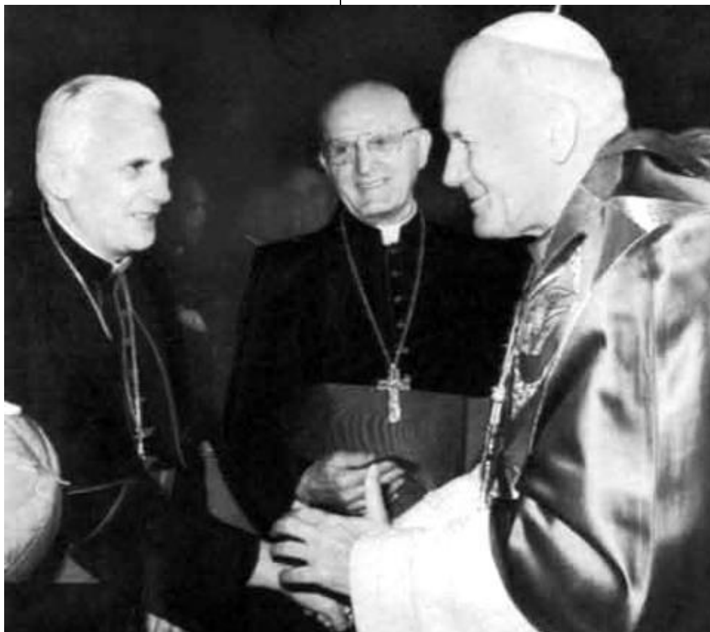
Jan Paweł II, Joseph Ratzinger, Jorge Bergoglio (trzech papieży)

Bez wątpienia na kształt posługi Benedykta XVI wywarł niezmierny wpływ kontekst jego wyboru i ówczesna sytuacja Kościoła. Papież Ratzinger przejął sukcesję na tronie Piotrowym po Janie Pawle II – człowieku bardzo otwartym, człowieku dialogu z innymi wyznaniem i kulturami, człowieku podróży apostołskich oraz kontaktów z wielkimi politykami i prostymi robotnikami, człowieku zaangażowanemu bez granic w zachowanie pokoju na arenie międzynarodowej, człowieku pochylającym się nad biednymi, cierpiącymi, prześladowanymi, człowieku widzącemu rolę Kościoła w nowej ewangelizacji na Starym Kontynencie a zarazem w niestrudzonej misji ad gentes , głosząc Chrystusa tym, którzy Go jeszcze nie znają. Z całą pewnością podjęcie tych wszystkich wyzwań naznaczonych osobistą charyzmą Karola Wojtyły nie było łatwe. Niemniej jednak Benedykt XVI przejął ster łodzi Piotrowej i wyznaczył jej konkretny szlak. Szlak ten nade wszystko był mocnym nawiązaniem do tradycji Kościoła i oparciem się na fundamentach katolickiej wiary. Nauczanie papieskie przyjęło charakter solidnego wykładu teologii. Już to pisać encykliki czy adhortacje, już to głosuąc kateche-