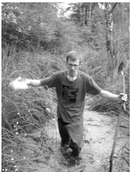
Odbywający praktyki studenckie w ZLPK OT Chełm

widoczne na drewnianym trzonie tablicy z wyblakłą już nazwą leśnictwa.