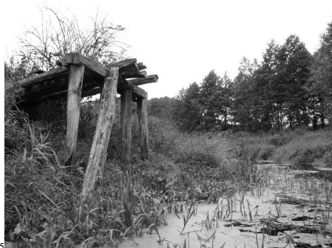
Zerwany most na Uherce

Jak widać na terenie Chełmskiego Parku Krajobrazowego można uprawiać różne formy turystyki kwalifikowanej. Oznakowane trasy prowadzą przez wszystkie najcenniejsze siedliska i ukazują charakterystyczne krajobrazy Parku. Niemal każda forma turystyki praktykowane na tym obszarze wymaga jednak od uczestników pewnych umiejętności oraz przygotowania kondycyjnego. Planując trasę palcem po mapie należy pamiętać, że nie wszystkie odcinki szlaków są łatwe do przejścia a stopień ich trudności zależy od pory roku i warunków pogodowych. Jedynie szlaki rowerowe wyznaczone po leśnych duktach i terenach rolniczych nie powinny zaskoczyć turystów. Biegają one drogami gruntowymi i asfaltowymi przejezdnymi przez cały sezon wycieczkowy. Inaczej się ma szlaków pieszych i konnych, których niektóre odcinki są niemal nie do przejścia bez wcześniejszego przygotowania a uprawiana na nich turystyka ociera się o sport ekstremalny.