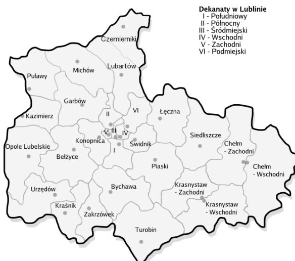
Mapka dekanatów Archidiecezji Lubelskiej

kapłanów jest pracownikami naukowymi na wyższych uczelniach.