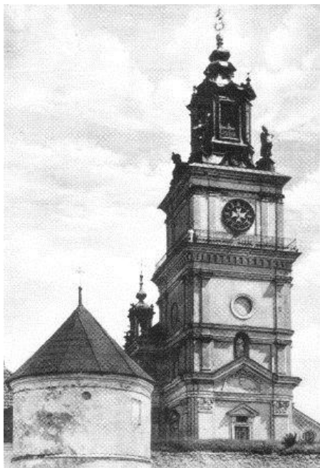
Podkamień, pow. Brody, woj. tarnopolskie. Kościół rzymsko-katolicki w obrębie masywu klasztornego O.O. Dominikanów. Marzec 1944