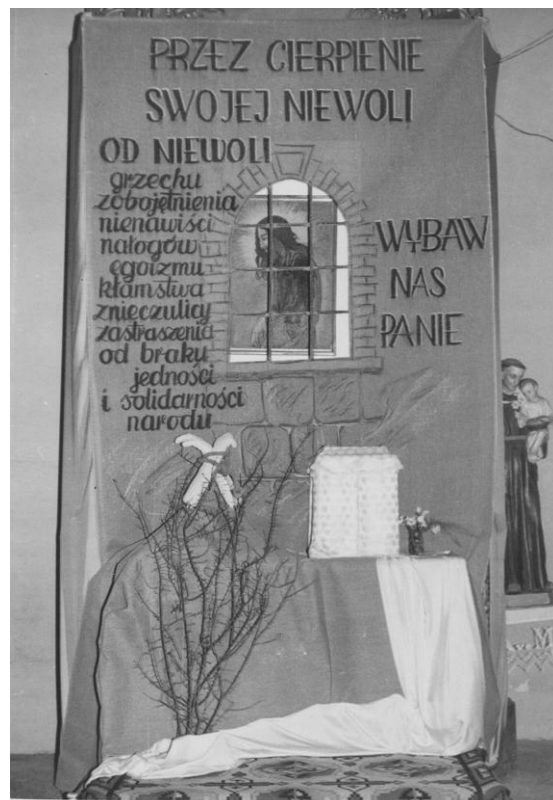
Dekoracja Wielkanocna z kościoła p. w. Serca Jezusowego w Tomaszowie – 1985 r.

po tych doświadczeniach wstąpić do seminarium diecezjalnego. Będąc alummem nadal utrzymywał kontakty z tomaszowską ekstremą . Młodzieży, młodym kapłanom, działaczom Solidarności jawił się jako bohater i „dobry duch”. Przyjaźń pomiędzy tymi kapłanami – dzisiaj ze Świerż i Buśna – jest żywa po dzień dzisiejszy. Obydwaj zapisali piękną kartę w wysiłku na rzecz wolnej Polski.