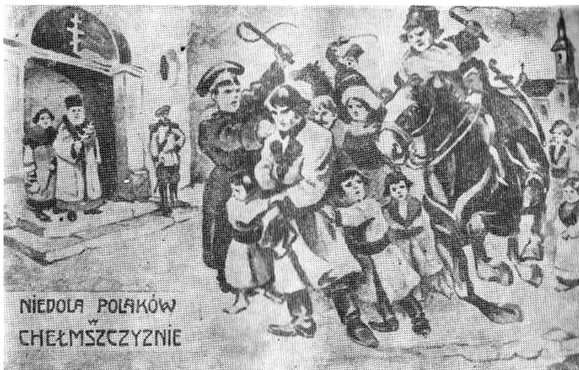
Pocztówka wydana we Lwowie

Następstwem ukazu tolerancyjnego Mikołaja II, wydanego 17 kwietnia 1905 r., było masowe odejście byłych unitów od prawosławia, mimo wielu utrudnień ze strony władz. Ich liczba na terenie Królestwa wahała się w granicach 150-200 tys. W atmosferze „odwilży” – spowodowanej sytuacją, w jakiej znajdował się wówczas carat (wojna rosyjsko-japońska, wydarzenia rewolucyjne) – strona polska podejmowała różne akcje polityczne i oświatowe. Główną rolę w tym zakresie odgrywało ziemiaństwo polskie i duchowieństwo katolickie, a instytucjonalnie: Narodowa Demokracja, Towarzystwo Opieki nad Unitami, Związek Katolicki, Polska Macierz Szkolna i Światło. Jednakże w latach następnych wszelkie poczynania polskie były skutecznie torpedowane przez władze rosyjskie.