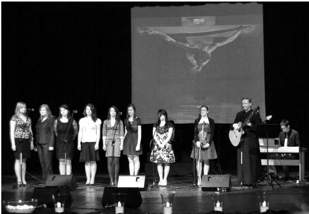
Schola podczas występu w Chełmskim Domu Kultury

wrześniu 2006 r. naboru do scholi parafialnej. Zgłosiło się kilka dziewcząt. Przez dłuższy czas funkcjonowaliśmy w niewielkim składzie, śpiewając jedynie przy akompaniamencie gitary podczas niedzielnych Mszy świętych o godz. 9.30. Początki nie były łatwe. Było nas zbyt mało do solidnego nagłośnienia bazyliki, mieliśmy niewyćwiczone głosy, ubogie instrumentarium... Ale sytuacja zmieniła się dość szybko. 1 kwietnia 2007 r. organizowaliśmy w Chełmie Dzień Młodzieży połączony z Dniem Papieskim. Mieliśmy taki plan, by na tę okazję zaprosić do grania i śpiewania jak najwięcej ludzi młodych i stworzyć „ścianę dźwięku”. Na spotkaniu przyszło sporo osób. Niektórym spodobała się panująca w naszym gronie atmosfera i sposób prowadzenia próby, więc zdecydowali się włączyć w pracę scholi na stałe. Przybyło kilka głosów i nowych instrumentów (skrzypce i flet). Było nas już wtedy całkiem sporo. Spotykaliśmy się na próbach co tydzień i dość szybko poszerzaliśmy zarówno nasz repertuar jak i umiejętności.