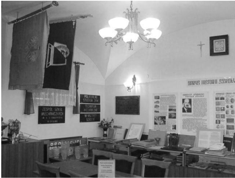
Izba Pamięci