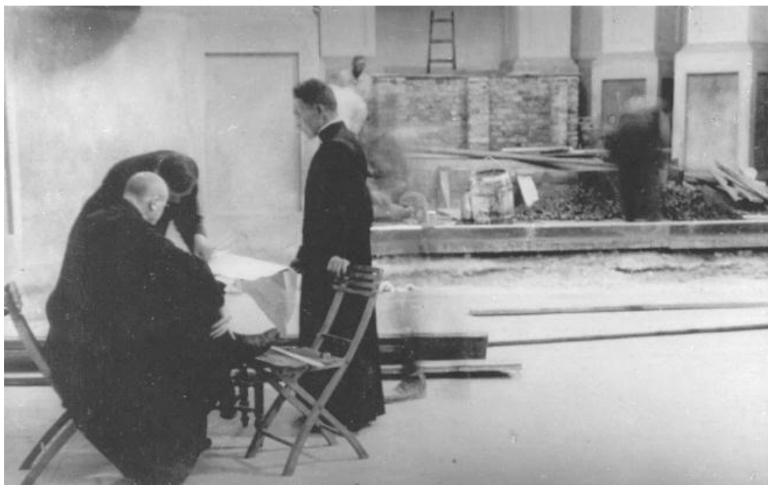
Prace remontowe wewnątrz bazyliki

W rzeczywistości nagrodzone prace nigdy nie doczekały się realizacji. Konkurs okazał się czysto teoretycznym przedsięwzięciem. Odbył się „teatr” z wybitnymi aktorami, ale bez szczęśliwego zakończenia dla chełmskiej społeczności. Jedynie rozgłos, jaki nadał konkurs całej sprawie, spowodował, że usłyszano w Warszawie o potrzebach artystycznych świątyni byłej katedry unickiej w Chełmie. Okazało się, że od werdyktu jury sędziowskiego do realizacji droga jest daleka.