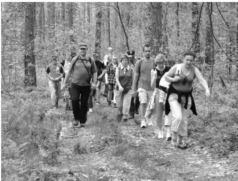
Na szlaku w Sobiborskim Parku Krajobrazowym

ubogie piachy i wydmy. Daje on w połączeniu z licznymi torfowiskami i dzikimi jeziorkami nie tylko trwale zapadający w pamięć efekt wizualny ale i zapachowy – nieporównywalny z żadnym innym zapachem lasu. Do tego można dodać krzewinki borówki czarnej, które dosłownie łanami porastają dno lasu i wydają ogromne ilości dorodnych jagód oraz grzyby z których najbardziej tu popularne kurki rosną niemal na środku leśnych duktów. Jeśli chodzi o świat zwierząt to odznacza się on na tle innych obszarów chronionych występowaniem rzadkich gatunków. Doskonałym na to przykładem może być stwierdzony niedawno pierwszy lęg w Polsce puszczyka mszarnego – ogromnej sowy dotychczas jedynie zalatującej na terytorium naszego kraju. Nie tylko pod względem przyrodniczym Sobiborski Park Krajobrazowy jest tak różnorodny. Pod względem kulturowym też znajdujemy swoistą mozaikę. Jezioro Białe – leżące w otulinie parku to krystalicznie czysta woda przyciągająca rzesze wczasowiczów. Gwar ludzi, sklepiki i dyskoteki z jednej strony z drugiej zaś miejscowość Sobibór Stacja z pozostałością byłego hitlerowskiego obozu zagłady. Wszystko to tworzy niezapomniany klimat tego parku i pozwala czuć się dobrze zarówno ludziom pragnącym spokoju i zadumy jak i aktywnego sportu i zabawy.