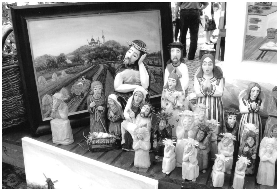
Targi sztuki ludowej w Lublinie, 2011 r.