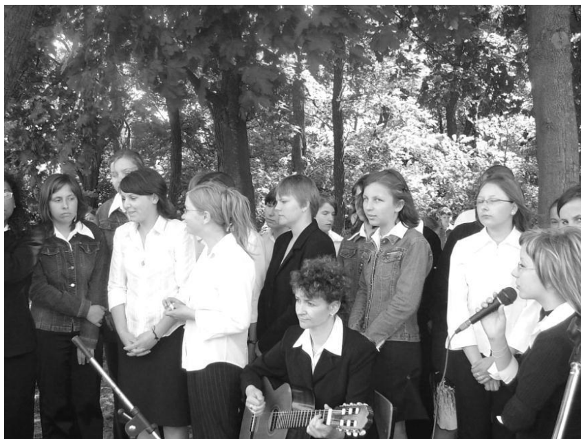
Zespół Omni Modo podczas Mszy św.

W roku szkolnym 1998 zorganizowałam nabór i założyłam Zespół Wokalny złożony wtedy jeszcze z uczniów klas IV-VIII Szkoły Podstawowej. Próby zespołu odbywały się na zajęciach pozalekcyjnych. Obecnie zespół wokalny Omni Modo to głównie uczniowie gimnazjum.