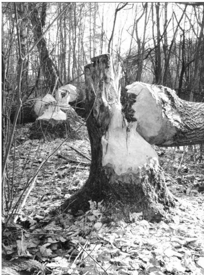
Zgryzy bobrowe

Destrukcyjny wpływ naszego bohatera jest powszechnie znany. Media bardzo chętnie opisują wszelkie straty związane z jego działalnością: zalane pola, spuszczone woda ze stawów rybnych, uszkodzone wały, wycięte drzewa. Dla przeciętnego zjadacza chleba o obojętnym stosunku do przyrody są to wystarczające powody, aby wciągnąć bobra na listę szkodników i postulować o jego odstrzał. Jest jednak co najmniej kilka powodów, by je lubić albo przynajmniej rozumieć i szanować.