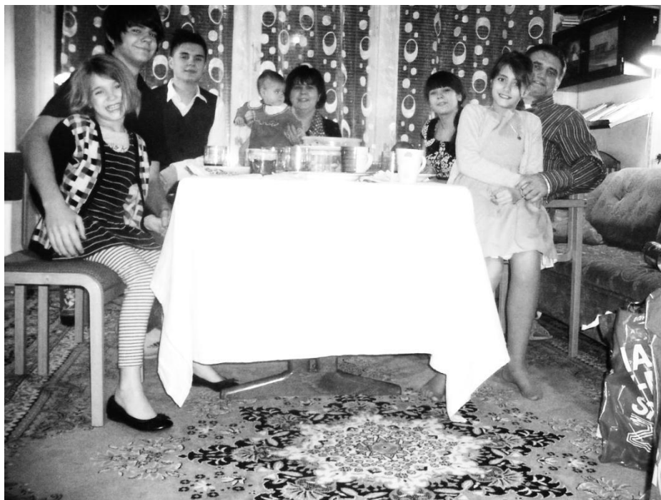
Wigilia 2011 - Sztokholm

W Sztokholmie istnieją dwie wspólnoty, w których jesteśmy z trójką najstarszych dzieci.