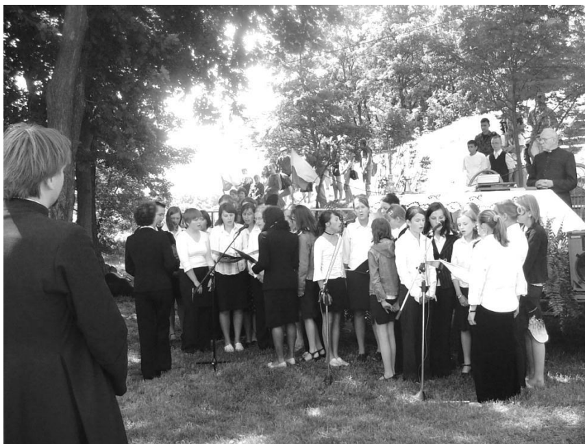
Pamiątkowa fotografia ze zlotu

Cykliczne spotkania w Uchańce miały niewątpliwie wielkie znaczenie dla młodego pokolenia, przybliżały wydarzenia z odległych czasów, działając szlachetnie i wychowawczo.