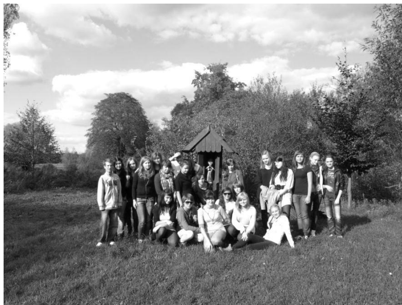
Młodzieży z I LO im. Stefana Czarnieckiego w Ogrodzie Świętego Franciszka

czyka błotnego. Ciekawą częścią ogrodu jest sad ze starymi odmianami śliw, jabłoni i gruszy, gdzie gnieźdzą się ptaki.