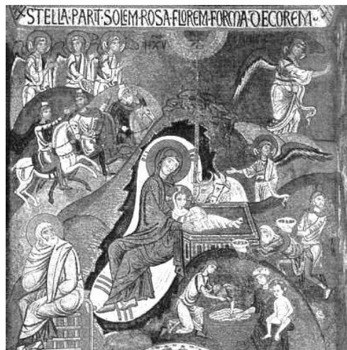
Narodziny Chrystusa ok. 1143, mozaika, Palermo, Capella Palantina

Sposób ujmowania Bożego Narodzenia w dziełach malarskich zmieniał się wraz z epokami. Różnorodność przedstawień tego samego wydarzenia jest imponująca. Temat ten pojawił się w malarstwie w IV wieku. Artyści w tamtym czasie w swoich dziełach przedstawiali zazwyczaj Dzieciątka leżące w koszu w grocie lub stajni, w pobliżu którego widać zwierzęta – woła i osła. Takie przedstawienie okoliczności Narodzin Pańskich wynika z opisów zawartych w apokryfach. Przykładem może być Ewangelia Pseudo-Mateusza, w której autor opisuje, że Jezus po przyjściu na świat w grocie betlejemskiej, został przeniesiony przez Maryję do żłóbka znajdującego się w stajni, gdzie wół i osioł oddali mu pokłon.