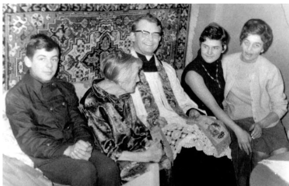
Lubartów 1971 r. - autor tekstu pierwszy z lewej

chownym drzwiami. Będąc ministrantem, uprzedzałem mieszkańców ulicy zapowiedzianej do wizyty duszpasterskiej w niedzielnych ogłoszeniach, mówiąc: „Ksiądz chodzi po kołędzie, czy może do państwa wstąpić?” Na karteczce podawałem numery domów czy mieszkań, gdzie kapłan bez skrępowania wchodził i prowadził stosowną modlitwę i rozmowę. O wiele łatwiej było nawet dla samego mieszkańca odmówić chłopakowi, niż samemu księdzu.