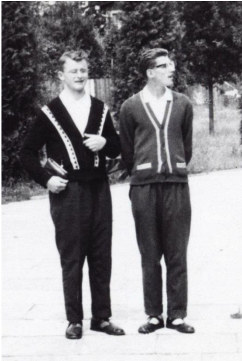
Niepokalanów, 1962 r.