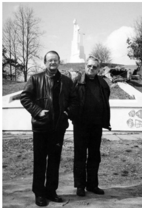
Wilno, 2001 r.