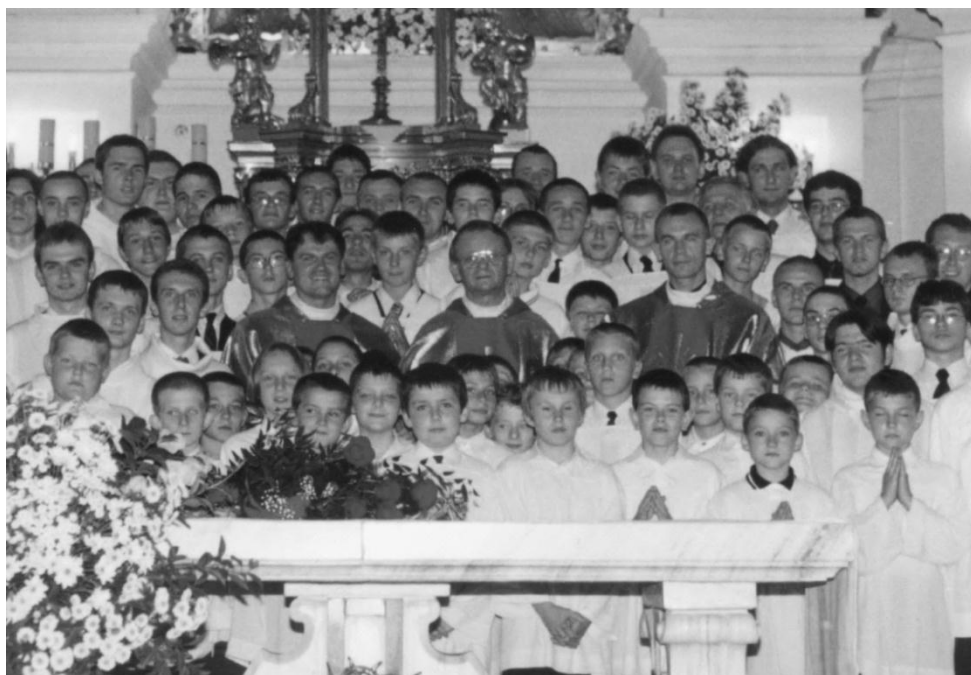
Chełm, 2001 r.

powiedzieć, dość wyjątkowa. Kiedy w zakrytści cichły nagle wszystkie rozmowy, co wbrew pozorom jest dość rzadką sytuacją, to nawet z zamkniętymi oczami, można było bez wątplenia stwierdzić, że na pewno wszedł do niej Ksiądz Infulat. Na potrzeby odprawianych przez Niego nabożeństw, cała służba liturgiczna zamieniała się w istny zastęp aniołów. Spod naszych świeżo upranych i wykrochmalonych komż wyciągaliśmy skrzydła, a nad głowami zapalaliśmy aureolki, modląc się chyba najbardziej o to, by wszystko poszło zgodnie z planem i by cała Msza św. i nasza radosna posługa nie zakończyła się jedną wielką reprimendą. Ksiądz Infulat jest bowiem perfekcjonistą, więc także i od nas, małych nicponi, zawsze wymagał nie tylko pobożności, lecz również rzetelności i pełnego profesjonalizmu. W swoim zachowaniu przypominał on dobrego ojca, stawiającego konkretne wymagania, którym z trudem chcieliśmy sprostać. Muszę jednak przyznać, że ten cały wysiłek wkładany w przygotowanie do liturgii bardzo nas jednociżył, przez co w dość dużej bazylice zawsze czuliśmy się jak u siebie, a utarte wyrażenie „dom naszej Matki”, nabierało bardziej dosłownego znaczenia.