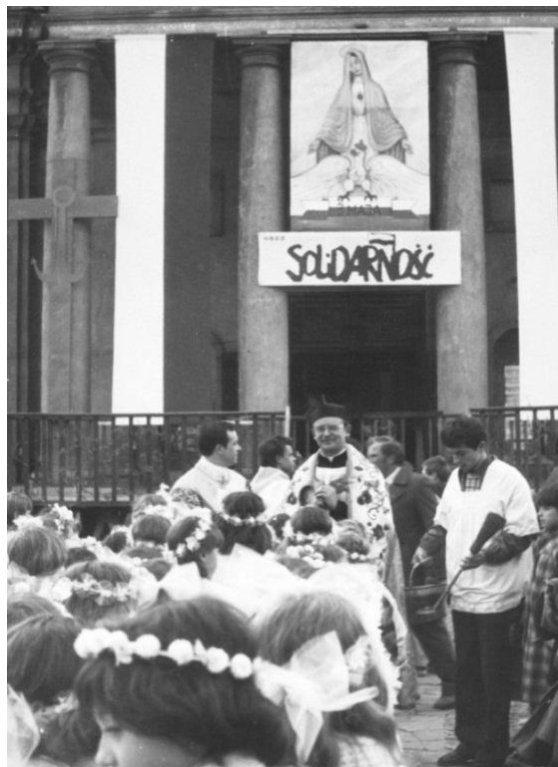
Chełm, 3 maja 1981 r.

się na niepodległość, ale i ruch odnowy wewnętrznej narodu, jako nieodłączny atrybut odzyskiwanej wolności. W jednym z swoich tekstów Ks. Infułat zaznaczył: „należałem do grona tych Polaków, którzy naprawdę uwierzyli w autentyczność „Solidarności”, w jej ideały, tak bliskie Ewangelii” [Zwyczajne świadectwo], zaś datę 13 grudnia określa „krzyżowaniem Ojczyzny, która usiłowała dźwigać się z różnorodnych zniewoleń i upadków” [Chełmska Kalwaria].