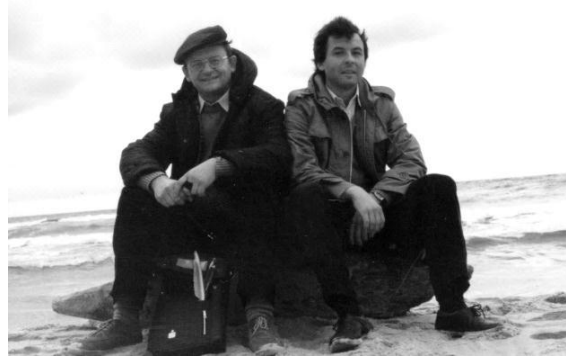
Bałtyk - październik 1983 r.

pośrednika dwóch światów: Boskiego i ludzkiego.