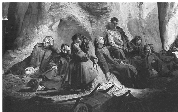
Jacek Malczewski, Niedziela w kopalni

Wigilijne potrawy Sybiraków często ograniczały się do czarnego chleba i wrzątku, ale wszyscy wiedzieli, że nie jadło było najważniejsze w tym dniu. Radość dawała możliwość wspólnego śpiewania polskich kolęd, łamania się chlebem i składania sobie życzeń, które u wszystkich zazwyczaj były takie same: zdrowia i szybkiego powrotu do Polski.