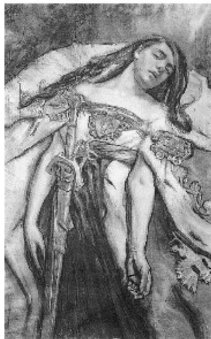
Stanisław Wyspiański, Polonia, fragment witraża do Katedry Lwowskiej

kiwać. Miejmy świadomość, trendy te – dyktowane różnymi racjami - mają potężne wsparcie w lansowanych stylach życia, wzorach kulturowych (nawet telewizja publiczna, by zyskać przychylną polityczną, promuje kicz rozrywkowy). Musimy wykrzesać ze swoich wnętrzb niezbędną samodzielność myślenia, podstawowy krytycyzm, by wszczynać niezbędny dyskurs. Nie w imię samego dyskusowania, a wykreślenia tych treści, bez których – jako naród – nie będziemy mogli normalnie się rozwijać (nie tania rozrywka stanowi o naszej kondycji ducha). Musimy stanąć ponad powszechnością, relacyjnością i pisać kolejne rozdziały kultury łacińskiej, bo tylko ona pozostaje gwarantem normalnego rozwoju narodu, zachowania jego bezpieczeństwa kulturowego.