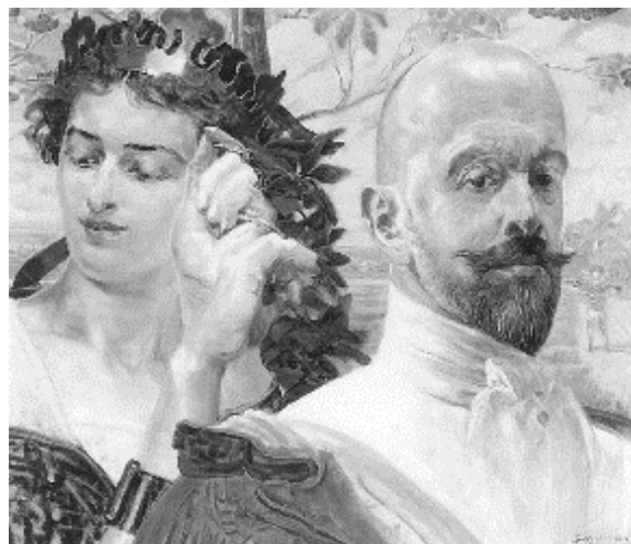
Jacek Malczewski, Autoportret z Polonią

Dla wielu spośród nas, przyznajmy, powyższe poszukiwania wydają się jako zbędne. Porwała nas przeciętność, w jakiejś mierze powszechność, zbliżająca się do poziomu kiczu,