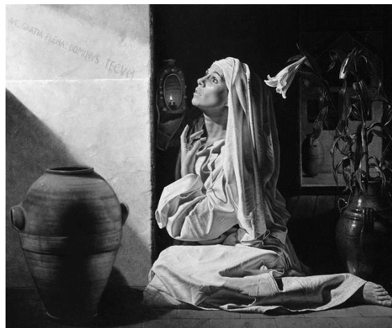
Aurelio Bruni, Zwiastowanie

w historię świata i w historię każdego z nas, dając nas bezgraniczną miłością, tak, że staliśmy się Bożymi synami i córkami. Stąd też wszyscy staliśmy się braćmi i siostrami. I tylko od nas zależy, czy skorzystamy z tego wielkiego daru miłości i rzucimy się w objęcia Ojca niebieskiego. Tylko od nas zależy, czy będziemy w geście miłości, czasami pojednania, wyciągać rękę do bliźniego.