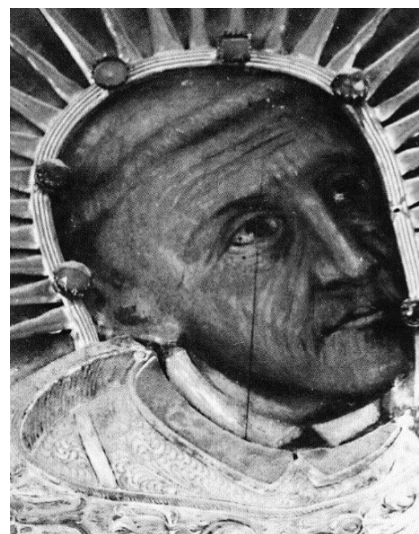
Autor anonimowy, Wincenty Kadłubek

Wiek XII i XIII przyniósł nam kolejnych świętych. Trzeba tu przywołać najpierw postać św. Ottona z Bambergu (ok. 1061-1139), apostoła Pomorza. Za nim podąża wielu świętych i błogosławionych, związanych z dynastią Piastów. Są to św. Jadwiga Śląska (zm. 1243), św. Kinga (zm. 1292), bł. Jolanta (zm. 1298) i bł. Salomea (zm. 1268). W tym roku przypada 750. lecie jej śmierci i dokonano rekognicji kanonicznej jej relikwii, spoczywających w bazylice ojców franciszkanów w Krakowie. Nadto w ub. roku Stolica Apostolska udzieliła „nihil obstat” w sprawie rozpoczęcia procesu beatyfikacyjnego kolejnego Piasta – księcia Henryka Pobożnego (zm. 1241), o co prosił biskup legnicki.