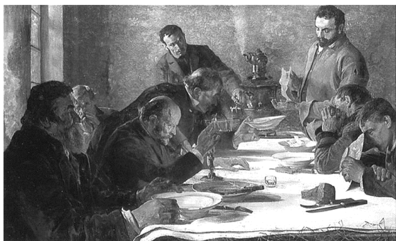
Jacek Malczewski, Wigilia na Syberii

Impulsem do napisania niniejszego artykułu jest obraz Jacka Malczewskiego Wigilia na Syberii (1892 r., Muzeum Narodowe w Krakowie) oraz wiersz powstały w wyniku inspiracji tymże obrazem, pod tym samym tytułem, napisany w roku 1980 przez Jacka Kaczmarskiego i wspianiale wyśpiewany przez trio bardów w niezapomnianym składzie: Kaczmarski, Gintrowski, Łapiński.