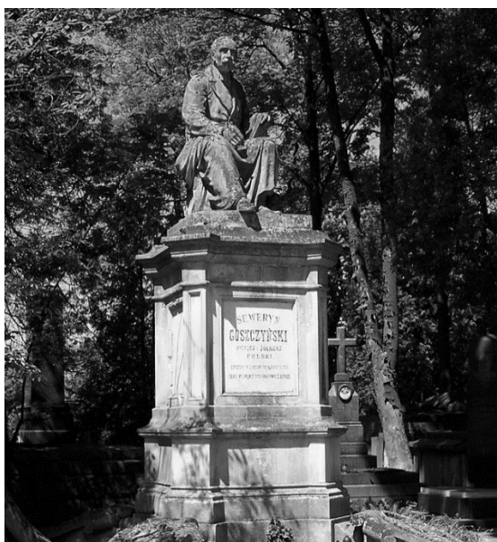
Cmentarz Łyczakowski, Grób Seweryna Goszczyńskiego

Stanisław Kostka]. Zagrożona jest całym systemem życia społecznego, publicznego, ekonomicznego, politycznego. I na nowo staje się dla naszego pokolenia problemem wolność wewnętrzna, wolność ducha ludzkiego, żeby się nie dać kupić, żeby nie zrezygnować ze swej wewnętrznej prawdy, żeby nie pójść na różne konformizmy i ułatwienia” 2 . Jesteśmy obecnie na etapie prawdziwego sprawdzianu z naszej deklarowanej miłości do Jana Pawła II.