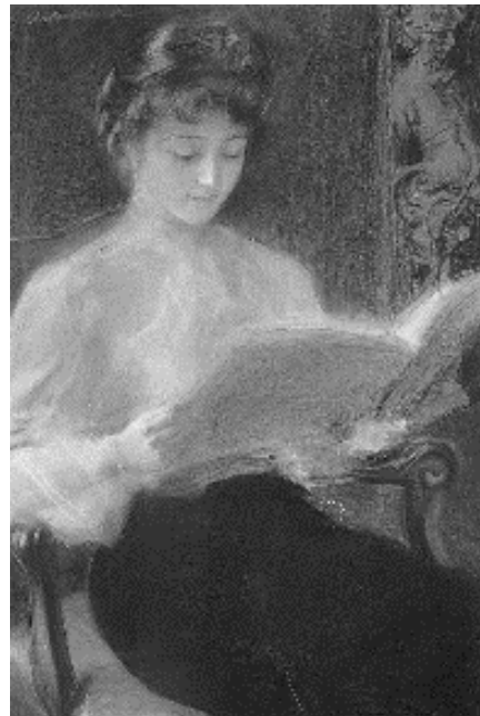
Teodor Axentowicz, Czytająca

Realizowanie określonych wartości odbywa się w złożonym procesie wychowania którym kierują pedagodzy. To oni dobierają wartości zgodnie z oczekiwaniami i normami społecznymi, albo przeciw nim. Oni też zaznajamiają wychowanków z wartościami i kształtują wobec nich postawy i zachowania. Wartości w procesie wychowania występują zarówno w treściach, jak i metodach i w celach wychowawczych 3 . Zanim jednak wartości znalazły się w programach nauczania, podręcznikach i praktyce pedagogicznej okresu międzywojennego 1918-1939, musiały zostać wykreowane, obronione i społecznie zaakceptowane. Ten złożony proces miał miejsce po rozbiorach Polski i można uznać, że trwał ze zmiennym nasileniem do ogólnopolskiego zjazdu nauczycielskiego, zwanego Sejmem Nauczycielskim w 1919 r. Do Warszawy przyjechali wówczas polscy pedagodzy (802 delegatów z 44 organizacji nauczycielskich) aby wypowiedzieć się nie tylko na temat organizacji szkolnictwa (które należało odbudować i zorganizować), ale również aby dokonać oceny i wyboru głównych wartości, a także treści służących do realizowania w programach wychowania i kształcenia oraz w ustawach szkolnych, mających obowiązywać we wszystkich dzielnicach kraju 4 . Zadanie to nie należało do łatwych.