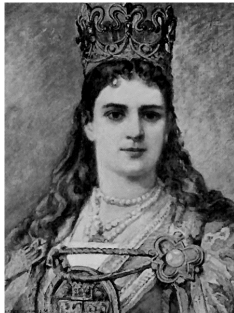
Jan Matejko, Jadwiga