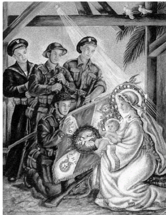
Autor nieznanym, Boże Narodzenie, 1942

dzieci, bo one dobrze wychowane i wykształcone są największym dobrem Ojczyzny, i one potrafią zdynamizować życie kraju na wszystkich płaszczyznach. Młodzi małżonkowie powinni czuć swoją odpowiedzialność za Ojczyznę, która obecnie wymiera. Dalej, podziwiając troskę Maryi i Józefa, którzy podjęli wędrówkę do Egiptu, by bronić Dzieciątko, powinniśmy bronić naszych dzieci przed współczesnymi Herodami, którzy chcą nasze dzieci zdemoralizować, wydziedziczyć z wartości duchowych, religijnych, a też patriotycznych.