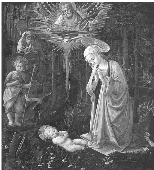
Fra Filippo Lippi, Adoracja dzieciątka w lesie